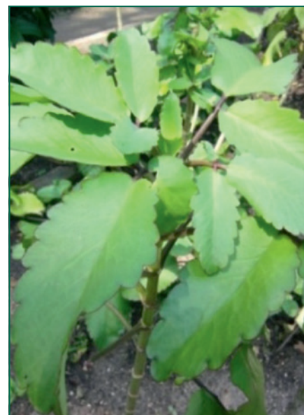
Abb. 1. Bryophyllum pinnatum .

Bryophyllum wurde von Rudolf Steiner, dem Begründer der Anthroposophischen Medizin, bereits 1921 für die Behandlung von damals noch «Hysterie» genannten Unruhezuständen empfohlen. Aus der Bezeichnung Hysterie lassen sich verschiedene Unruhe- bzw. hyperaktive Zustände als mögliche Indikationen für B. pinnatum ableiten. Dazu gehören z.B. Einschlafstörungen, unter anderem im Rahmen des Aufmerk-