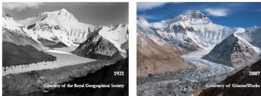
Rongbuk-Hauptgletscher (vgl. Innenseite)

Ein Bericht der Arbeitsgruppe im Auftrag der Päpstlichen Akademie der Wissenschaften