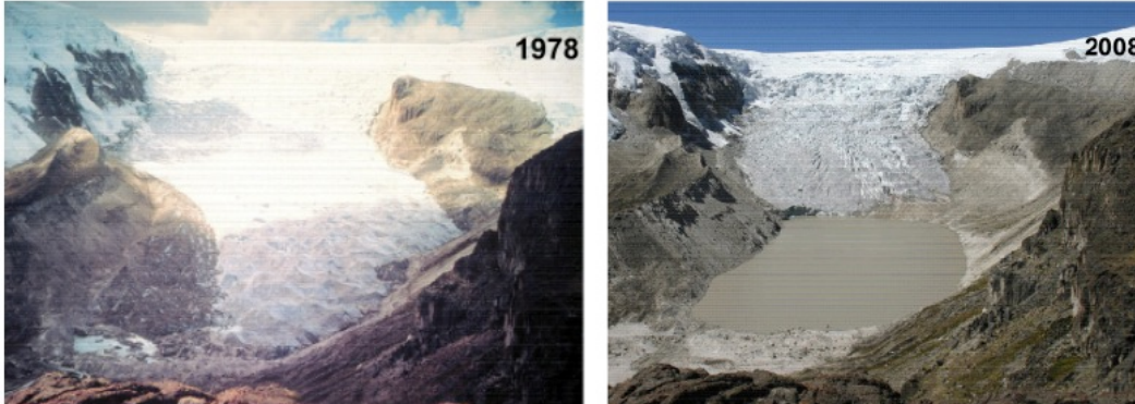
Qori Kalis Gletscherstrom (größter Gletscherstrom aus dem Quelcaya Inlandeis der südlichen peruanischen Anden).

Der anhaltende Klimawandel stellt eine tödliche Gefahr für Gebirgsgletscher dar