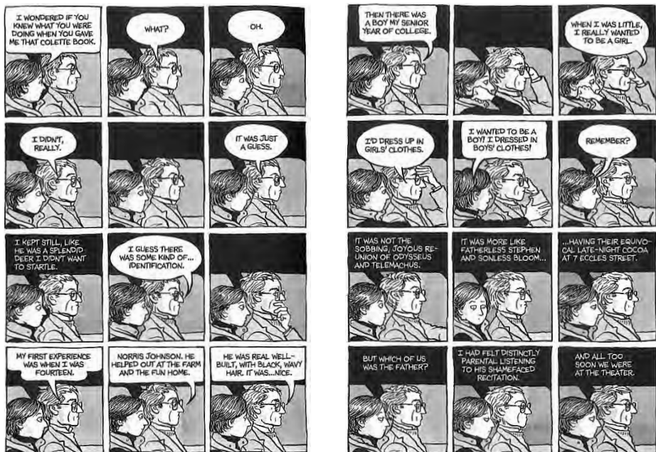
Illustration from Fun Home by Alison Bechdel. Copyright © by Alison Bechdel.

Eindrücklich geschieht dies etwa in einer Anhäufung kleiner und beinahe gleich bleibender Panels, mit der die Comic-Zeichnerin bei einem zentralen Gespräch zwischen Vater und Tochter kunstvoll eine Atmosphäre von Anspannung und Verlegenheit kreiert, indem das zögerliche Gesprächstempo durch Schweigepausen in Zwischenpanels illustriert wird. 18 In dieser Szene hat Bruce erst kürzlich von der Homosexualität seiner Tochter erfahren und outet sich ihr gegenüber ebenfalls. Bechdel verwendet den zeichnerischen Raum hier bewusst dazu, bestimmte Stimmungen innerhalb einer Handlungssequenz herzustellen: Die aneinandergereihten kleinen Panels zeigen Vater und Tochter auf einer Doppelseite mit fast gleich bleibender Position und Mimik. Einige Panels beinhalten Dialog in Sprechblasen, einige nur die Gesichter ohne Sprech- oder Gedankenblasen (Schweigepausen). Andere wiederum sind durch Bechdel aus der Retrospektive kommentiert. Die fast spürbare Unbehaglichkeit in dieser Szene wird also vor allem zeichnerisch-räumlich erreicht. Zugleich stellt diese Szene den aufrichtigsten Moment zwischen Alison und ihrem Vater dar, der durch die Vergabe einer Doppelseite zusätzlich an narrativem Gewicht gewinnt. Alisons Eingeständnis,