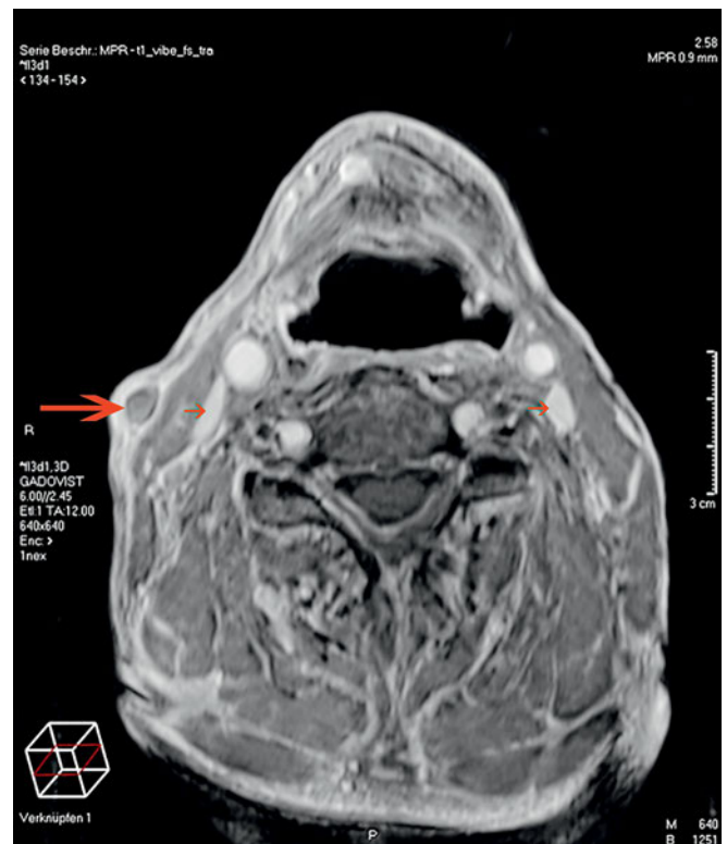
Abb. 2 Axiales Kontrast verstärktes 3-D-MR-Bild (T1 Gd) mit fehlender Kontrastierung des Gefäßlumens der VJ externa rechts, Auftreibung des Gefäßes und entzündlicher Anreicherung der Gefäßwand (grosser Pfeil). Die VJI (kleine Pfeile) ist beidseits offen.

Die Symptome einer druckdolenten, verhärteten Gefäß-Nerven-Scheide in der Halsregion mit zunehmendem Berührungsschmerz kann als relativ typisch betrachtet werden und ist auch an anderer Stelle beschrieben (MAIER ET AL. 2010; CHATTOPADHYAY ET AL. 2012; OHBA ET AL. 2012). Ansonsten war der Patient beschwerdefrei, hat also keine der sonstigen typischerweise beschriebenen Symptome wie Dyspnoe, Tachypnoe oder Dysphagie aufgewiesen. Auch die klinische Erstuntersuchung zeigte neben den oben genannten Befunden keine