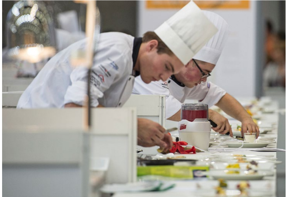
Unterdurchschnittlich zeigen sich die beruflichen Perspektiven in den Dienstleistungs- und Verkaufsberufen. Es wäre allerdings falsch, von diesem Quervergleich auf schlechte Berufschancen im absoluten Sinne zu schliessen.

Der längerfristige Erfolg auf dem Arbeitsmarkt hängt nicht zuletzt vom erlernten Beruf ab. Generell haben Absolventen einer beruflichen Grundbildung deutlich bessere Chancen auf dem Arbeitsmarkt als ungelernete Arbeitskräfte. Aber nicht jede Berufslehre bietet dieselbe Garantie für einen erfolgreichen Erwerbsverlauf. Eine neue Studie des Stellenmarktmonitors Schweiz liefert dazu erstmals informative Kennzahlen. Es lassen sich Berufsfelder mit über- und unterdurchschnittlichen Perspektiven unterscheiden, aber auch solche mit konjunkturell stark schwankenden oder ausgesprochen uneinheitlichen Aussichten auf dem Arbeitsmarkt.