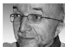
Dr. Stefan Sacchi Stellenmarkt-Monitor Schweiz, Soziologisches Institut der Universität Zürich

In der folgenden Zusammenfassung des Reports des Stellenmarktmonitors (siehe Kasten 1 ) konzentrieren wir uns auf die Unterschiede zwischen den verschiedenen Berufsgruppen. Im Zentrum steht dabei die Frage nach über- und unterdurchschnittlichen Chancen von Erwerbstätigen mit einer beruflichen Grundbildung im Alter von 26 bis 54 Jahren. Die Gesamtsicht der letzten zehn Jahre (siehe Grafik 1 ) zeigt, dass sich die Arbeitsmarktperspektiven je nach der Art des erlernten Berufs beträchtlich unterscheiden. Negativwerte verweisen dabei auf Nachteile und positive Werte auf Vorteile im Vergleich mit dem Durchschnitt über alle Berufsgruppen. 1