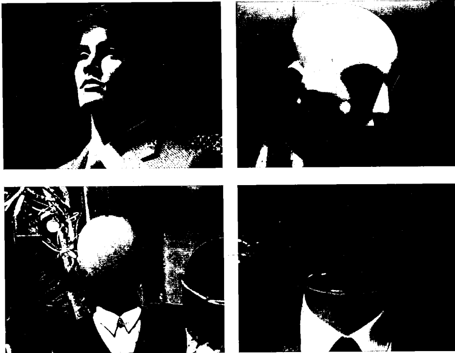
3-6 «Verfallsprozess bis hin zur totalen Gesichtlosigkeit»

Genmanipulation», erklärt der Reporter aus dem Off, würden diese Enten «dazu missbraucht, durch ständiges Wassertreten die Schiffahrtsstraßen um Zürich eisfrei zu halten». «In der Bahnhofstraße selbst sind die Zeichen für den, der sie sehen will, überall sichtbar, aber niemand hier scheint sie wahrzunehmen», fasst Krieg seine Recherche an einer Stelle zusammen, und deutet damit an, was die Krankheit so gefährlich macht: Die meisten Kranken wollen oder können ihre Krankheit nicht als Krankheit anerkennen. Sie ist für sie «einfach nicht existent, eine bloße Erfindung, vor allem der Jugend».