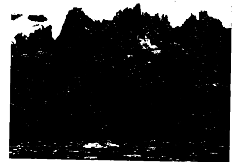
1-2 Eiszeit in Zürich

änderung der Menschen selbst einher. Wissenschaftler reden vom «Packeis-Syndrom», aber die Wissenschaftler und Ärzte wissen selbst nicht, um was es sich dabei genau handelt. Ob es eine Art Strahlenkrankheit ist oder ein Virus oder gar eine genetische Mutation unter dem Einfluss der Klimaveränderung – wir wissen es nicht. Niemand weiß es. Die Wissenschaftler wollen herausgefunden haben, dass ausgerechnet die Bahnhofstraße hier in Zürich Ausgangspunkt, sozusagen Herd dieser rätselhaften und grauenhaften Krankheit ist.