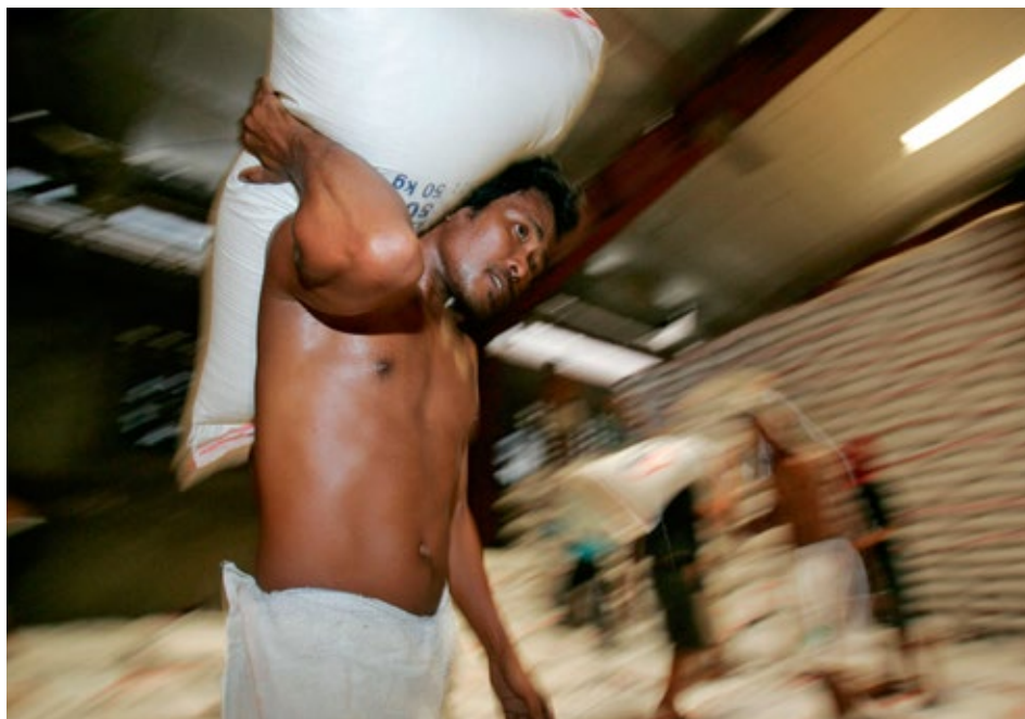
Ein Arbeiter schleppt einen Reissack in einem Lagerhaus auf den Philippinen. Während der Preishaussse 2007/2008 waren die Lagerbestände tief.

Was sind die Ursachen hoher Preisvolatilität auf den globalen Agrarmärkten? In der öffentlichen Diskussion wird oft die «Finanzialisierung» des Agrarhandels für die stark schwankenden Nahrungsmittelpreise verantwortlich gemacht. Dabei wird übersehen, dass Preisbewegungen primär auf Veränderungen der Verfügbarkeit von global handelbaren Nahrungsmitteln zurückzuführen sind. Diese realwirtschaftlichen Verhältnisse werden von der Politik und weniger von Finanzmärkten, die diese primär nachbilden, beeinflusst. Nachhaltige Ernährungssicherung bedingt institutionelle Rahmenbedingungen, die Anreize schaffen, in die Landwirtschaft zu investieren, und den fairen Handel mit Agrargütern ermöglichen.