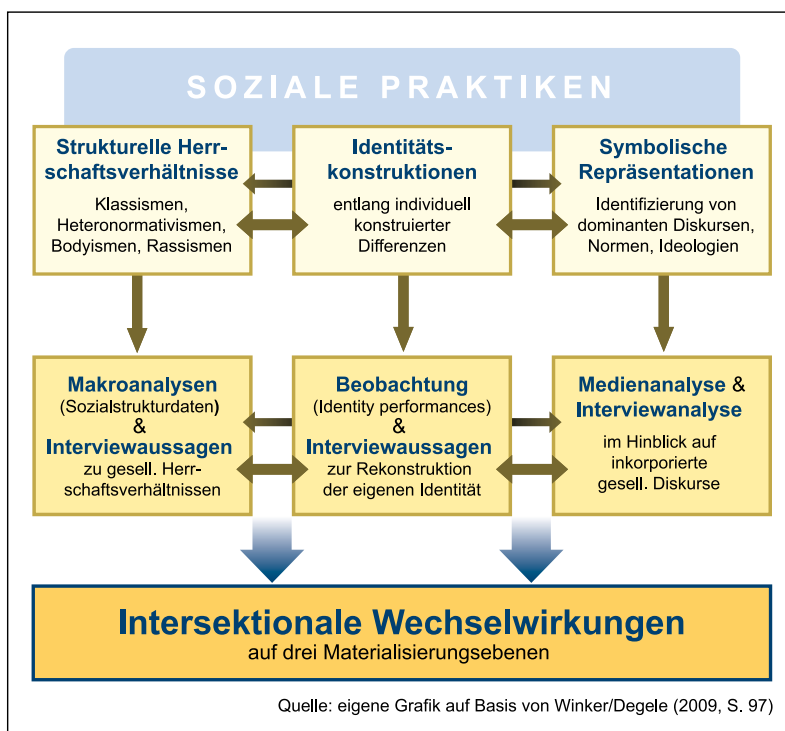
Abb. 1: Mehrebenenmodell zur Intersektionsanalyse

Die Geschlechterforschung bewegt sich zwischen den Ansprüchen einer anwendungsbezogenen Forschung zur Analyse von Armut, Ungleichheit und Macht sowie zu Praktiken der Entwicklungszusammenarbeit einerseits und andererseits einer kritischen, feministischen, stark theorieorientierten Geschlechterforschung. Die praxisorientierte Entwicklungsforschung liefert Erkenntnisse über die zunehmende Verarmung von Frauen, über die überproportional negativen Auswirkungen neoliberaler Politik oder der aktuellen Wirtschaftskrise auf Frauen (vgl. King und Sweetman 2010,