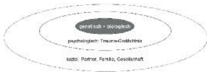
Abbildung 1: Interpersonelles Rahmenmodell der PTBS