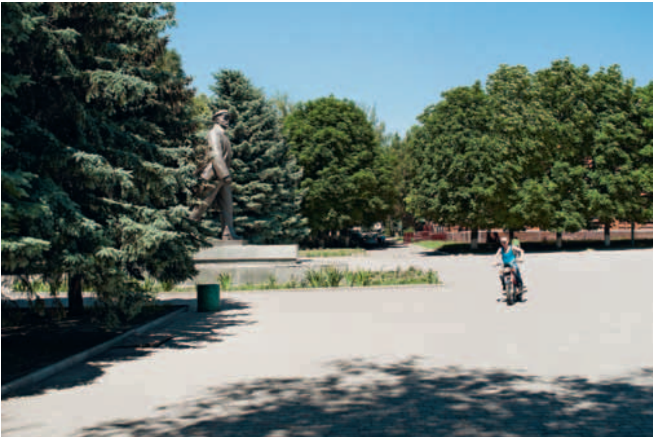
Leninstatue in einem Park in Krasnohrad, zwischen Poltava und Donezk.