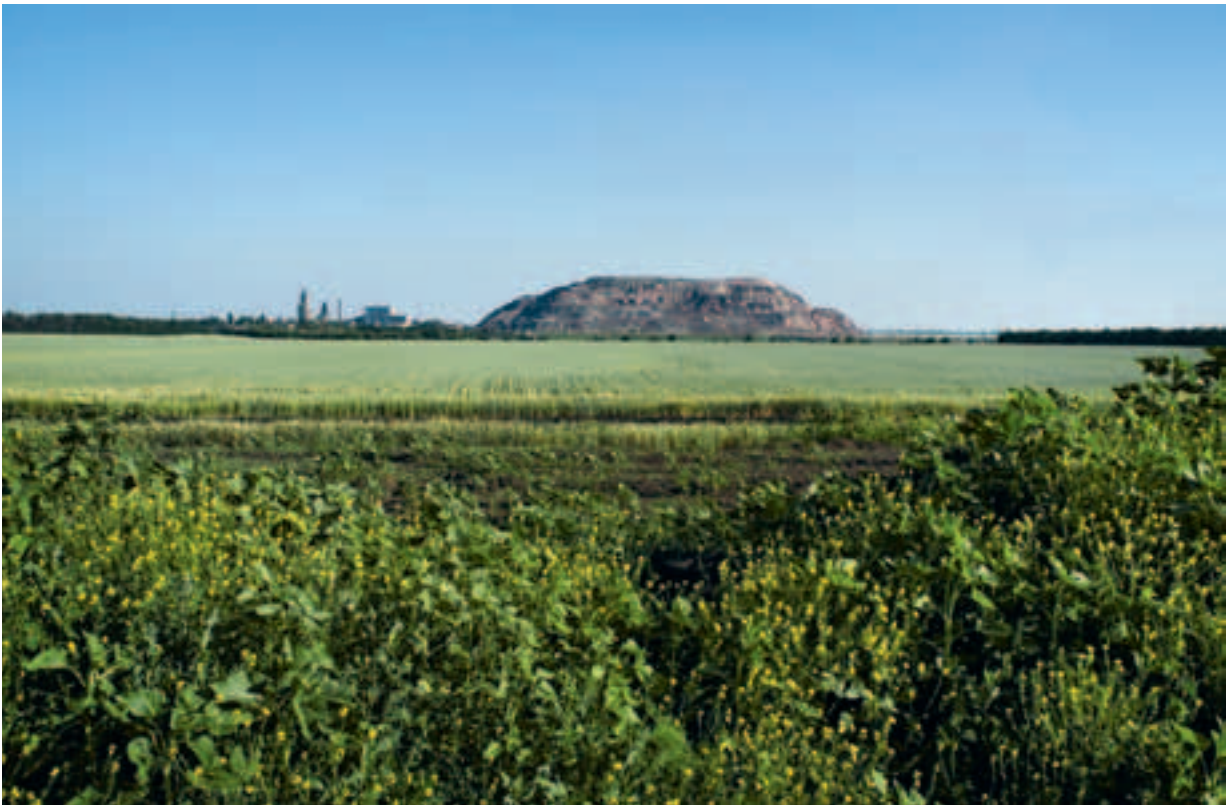
Spuren des Bergbaus im Donbass.