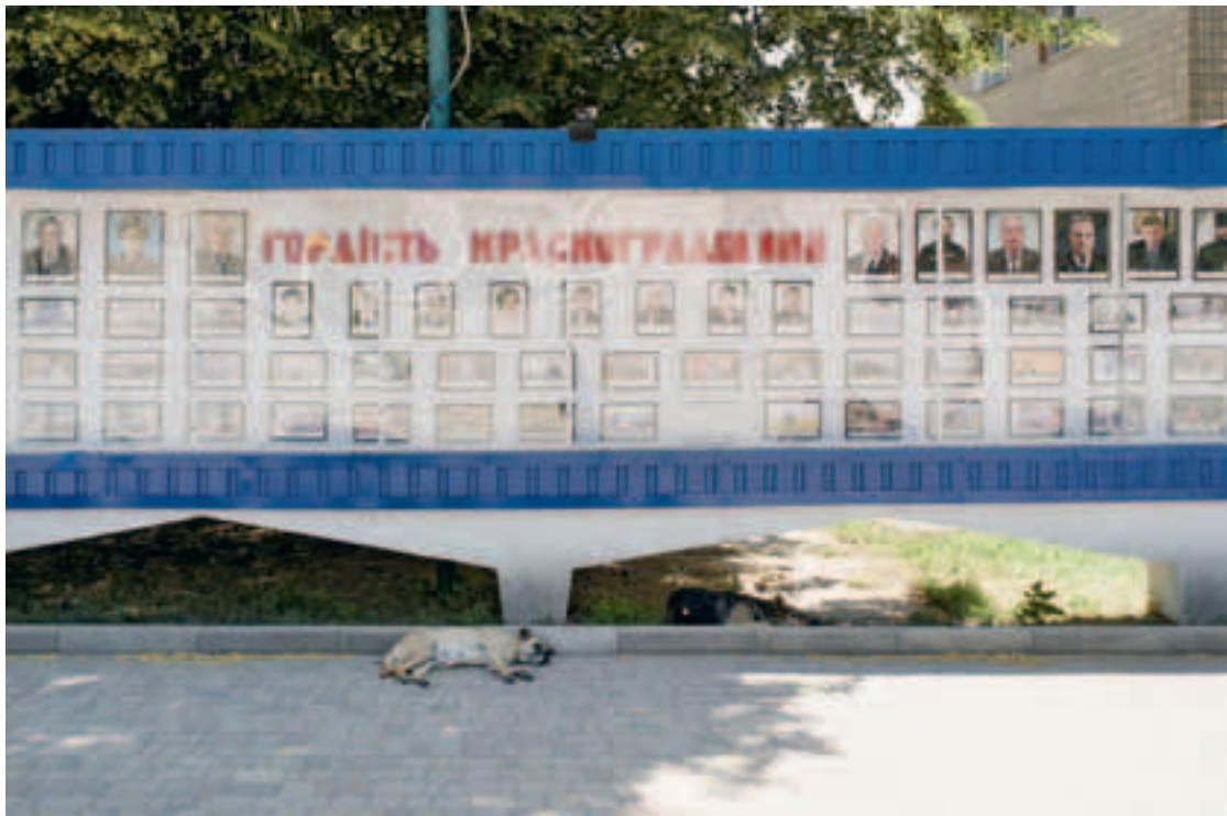
Ehrentafel, der Stolz von Krasnohrad.