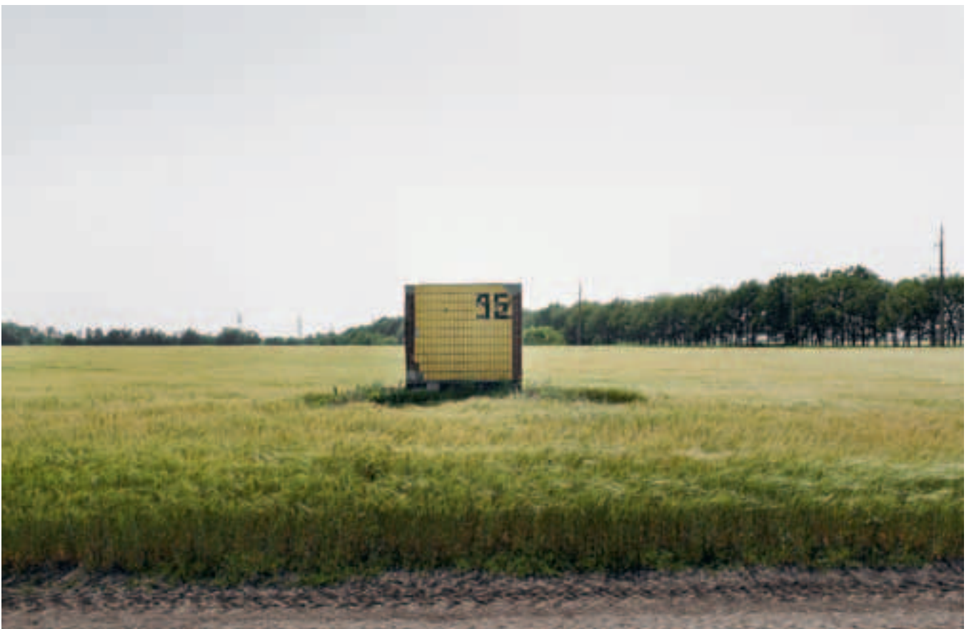
Ein Weizenfeld im Donbass.