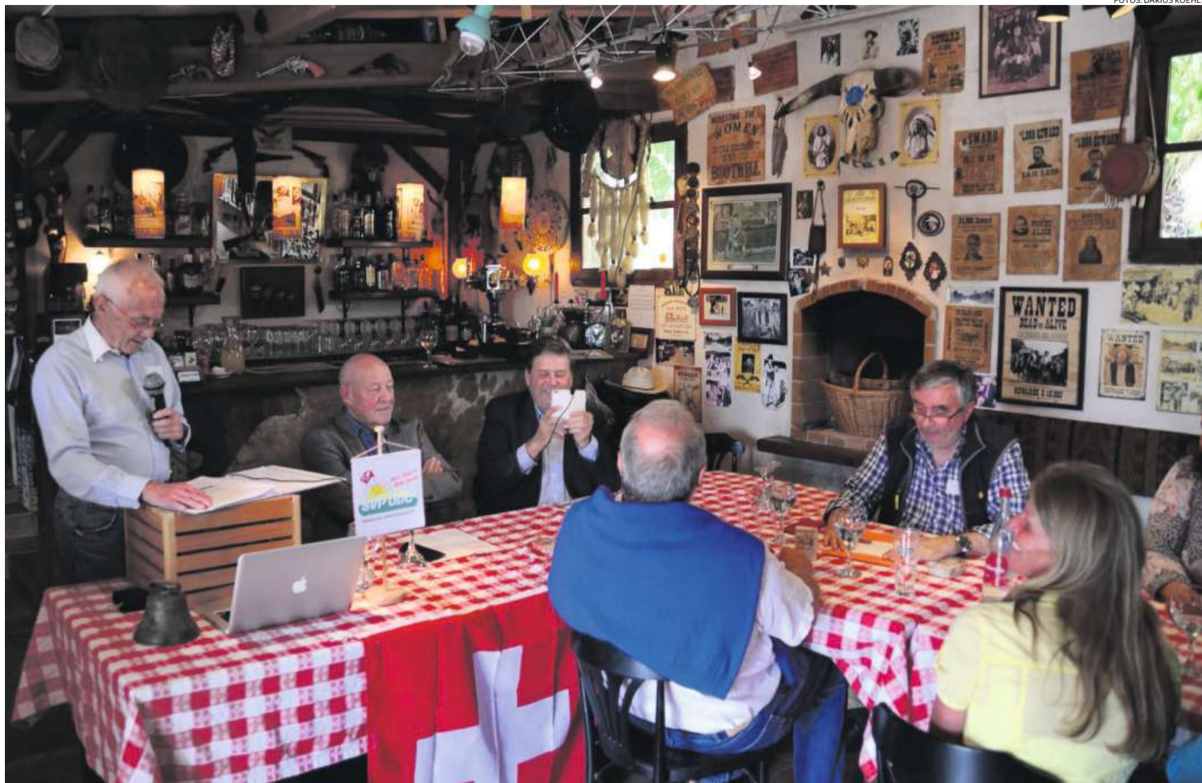
Heimatliche Gefühle in Western-Ambiente an der Costa Dorada: Die Generalversammlung der SVP-Sektion Spanien. (L'Ampolla, 25. April 2015)

flussen werden. Bochsler stützt sich allerdings nicht auf die gerade aktuelle Nachrichtenlage, sondern auf Zahlen: «Die kurzfristigen nationalen Trends berechne ich aus den kantonalen Wahlen, die im nationalen Wahljahr stattfinden.» Geeicht hat er sein Instrument, indem er es auf alle Nationalratswahlen seit 1995 anwendete. Es zeigte sich, dass beide Elemente, Kantönliche und nationale Trends, nötig sind, um zu zuverlässigen Resultaten zu kommen. Bei alledem betont Bochsler, dass jetzt noch unvorhersehbare Ereignisse Einfluss auf den Wahlausgang haben können. Während seine Berechnung den Vorteil habe, für alle Parteien in allen Kantonen Aussagen machen zu können, seien Umfragen im Vorfeld der Wahlen besser geeignet, solche kurzfristigen Trends zu erfassen. Klar ist auch, dass bezüglich Sitzgewinnen im Parlament die Listenverbindungen und Proporzglück wohl geradeso bedeutend sind wie allfällige Änderungen bei der Wählerstärke.