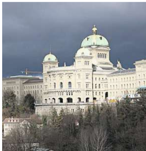
Das Bundeshaus im Morgenlicht.

Die FDP wird bei den eidgenössischen Wahlen im Oktober in fast allen Kantonen Wähleranteile gewinnen. Die Grünen dürften hingegen flächendeckend Stimmen verlieren. Die SVP legt zwar in den Kantonen mehrheitlich zu, jedoch mit drei bemerkenswerten Ausreissern. Die SP hat insgesamt kaum nennenswerte Änderungen zu erwarten. Der CVP droht derzeit in einer Mehrheit der Kantone eine weitere Erosion ihrer Wählerschaft. Die kleinen Mitteparteien BDP und GLP können nur vereinzelt leicht zulegen, hingegen drohen ihnen schmerzhaftere Verluste dort, wo sie bisher stark waren. So die kurze Zusammenfassung einer neuen Prognose im Hinblick auf die nationalen Wahlen, in der die 17 Kantone mit mindestens