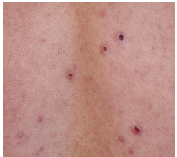
Abbildung 6: AIDS-Patient mit Syphilis, atypisches ulcerierendes Syphilid im Rahmen der Lues II.