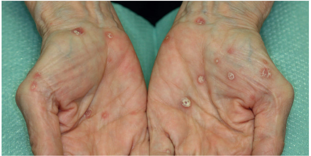
Abbildung 7: Palmare Syphilide im Rahmen der sekundären Syphilis.

dingt das langwirksame Penicillin (Benzathin-Penicillin), das in der Schweiz nach wie vor nur erschwert erhältlich ist, zu verwenden ist. Kurzwirksame Penicilline sind hingegen unwirksam .