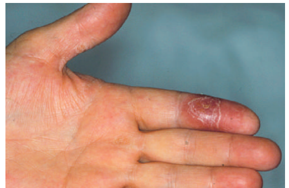
Abbildung 3: Extragenitaler Primäraffekt am Finger.