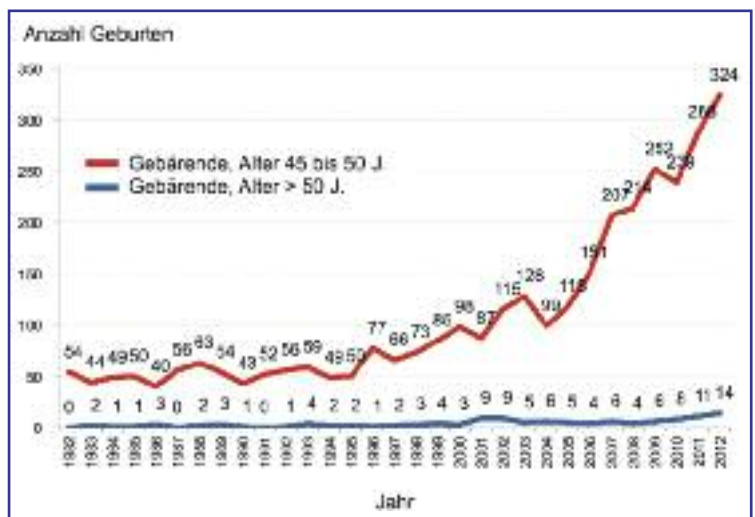
Abbildung 2: Das Bundesamt für Statistik BfS veröffentlicht jedes Jahr einen Überblick über das Alter der Frauen zum Zeitpunkt der Geburt. Hierbei stieg ab Ende der Neunzigerjahre der Anteil von Frauen, die ab dem 45. Lebensjahr ein Kind gebären. Dieser plötzlicher Anstieg kann durch die Inanspruchnahme von Behandlungen mit der Eizellenspende in ausländischen Zentren erklärt werden. 2012 waren 338 Frauen älter als 45 Jahre.

gleich vergleichbar sind, stellen die aufgrund der restriktiven gesetzlichen Voraussetzungen vielfachen Wiederholungen von frustrierten Therapieversuchen für viele Paare einen Grund für eine Behandlung in einem ausländischen Behandlungszentrum dar. Ein weiterer Grund für einen regen Fortpflanzungsmedizin-tourismus in andere Länder ist das Verbot der PID sowie der Eizellenspende. (Abbildung 2)