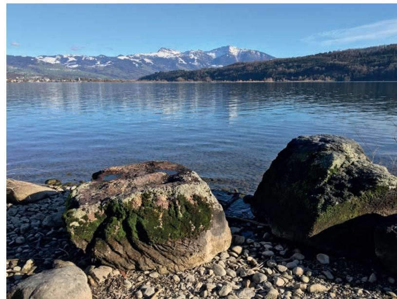
Abb. 2. Findlinge am Ufer des Zürichsees mit Dialytrichia mucronata.

Eigentlich auf der leider erfolglosen Suche nach dem Strandling ( Litorella uniflora ) am Zürichsee zusammen mit Niklaus Müller, sahen wir uns nebenbei am Ufer vor Oberbollingen eine Gruppe von halb im Wasser liegenden Findlingen an (Abb. 2). Neben verschiedenen pleurokarpn Wassermoosen (u.a. Hygrohypnum luridum , Hygroamblystegium tenax ) fanden sich oberhalb der Wasserlinie auch dunkelgrüne Polster von Hyophila involuta und hellgrüne Polster einer zunächst nicht erkannten Art, die sich bei der anschliessenden Bestimmung als Dialytrichia mucronata herausstellte.