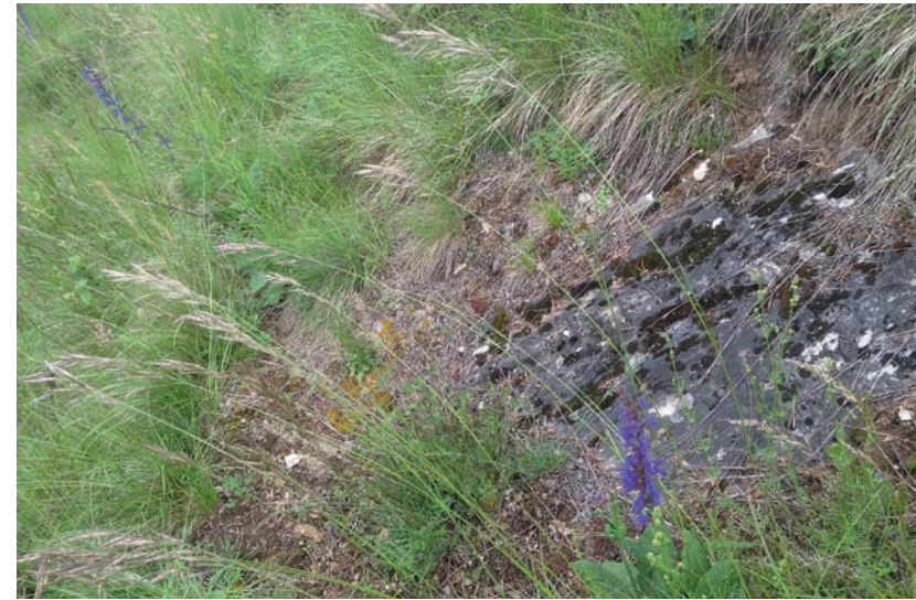
Abb. 3. Standort von Mannia fragrans in Tschlin. Wuchsort sind die offenerdigen Stellen links des Felsens.

Dass Mannia fragrans bisher nicht aus den noch recht ausgedehnten Trockenrasen an den Nordflanken im Haupttal des Unterengadins bekannt geworden war, ist eigentlich erstaunlich, zumal sie im angrenzenden Österreich aus der Umgebung von Innsbruck nachgewiesen ist (pers. Mitteilung Christian Schröck). Wahrscheinlich liegt es daran, dass diese Trockenrasen bisher kaum bryologisch bearbeitet wurden. Im letzten Sommer führte mich wiederum die Feldarbeit für die Wirkungskontrolle Biotopschutz ( www.wsl.ch/biotopschutz ) an einige dieser Standorte. In diesem Projekt werden die Moose in den Trockenrasen zwar nicht erfasst, doch sah ich Mannia zufällig bei der Rückkehr von einer Aufnahme an einer lückigen Stelle im Steilhang, wo sie zusammen mit Riccia sorocarpa wuchs (Abb. 3).