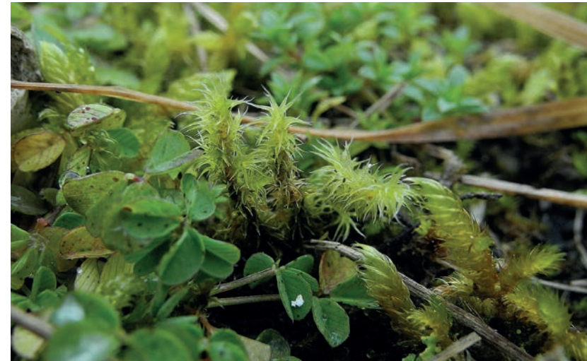
Abb. 4. Racomitrium elongatum zusammen mit Hypnum cupressiforme var. lacunosum in einer Trockenwiese im Kanton Schaffhausen.

Ahrens M. 1992. Die Moosvegetation des nördlichen Bodenseegebiets. Dissertationes Botanicae 190: 1-681.