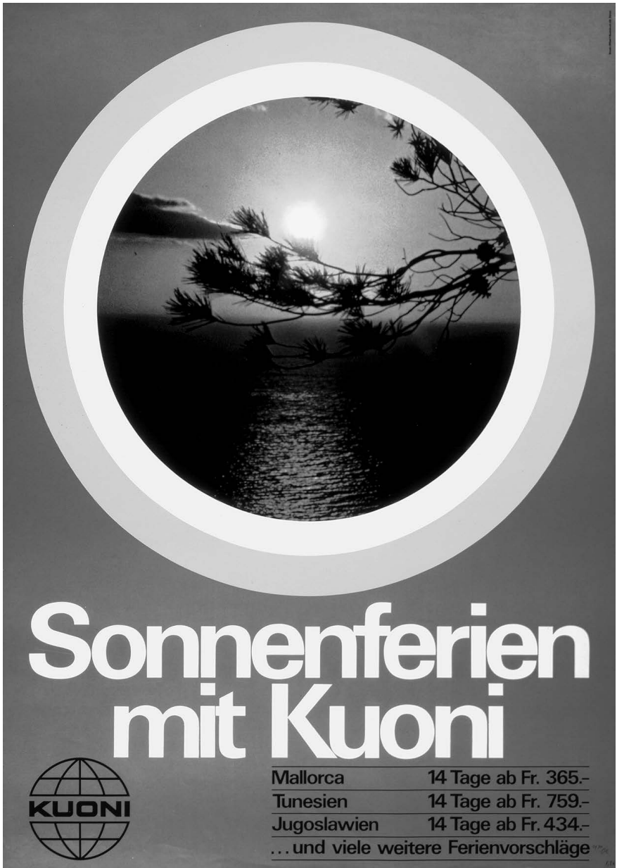
Abbildung 1. Werbeplakat der Kuoni Reisen Holding AG (1970er-Jahre).