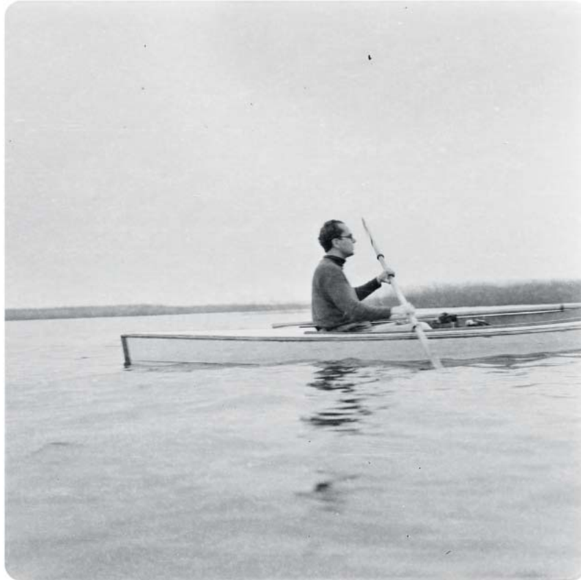
Recherche: Arno Schmidt 1953 auf dem Dümmer

Die Schmidts entziehen sich dem drohenden Prozess, indem sie ihren Wohnort ins liberalere Darmstadt verlegen.