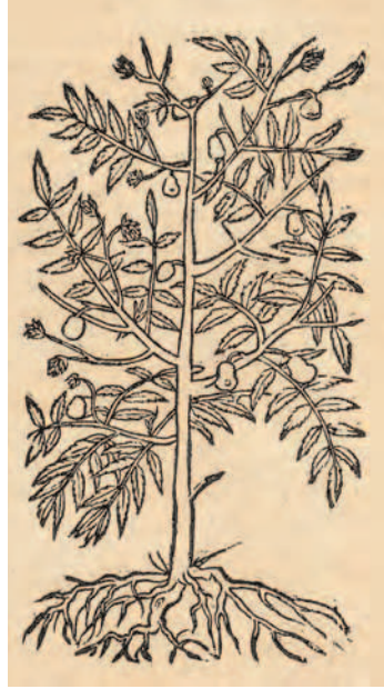
Abbildung 2 links

Holzschnitt einer Kulturbirne ( Pyrus communis ), der damaligen Zeit: Gelblangstilerbirn = Schlesischbirn. Historia Plantarum Universalis , Vol. 1, Cap. 4, S. 52