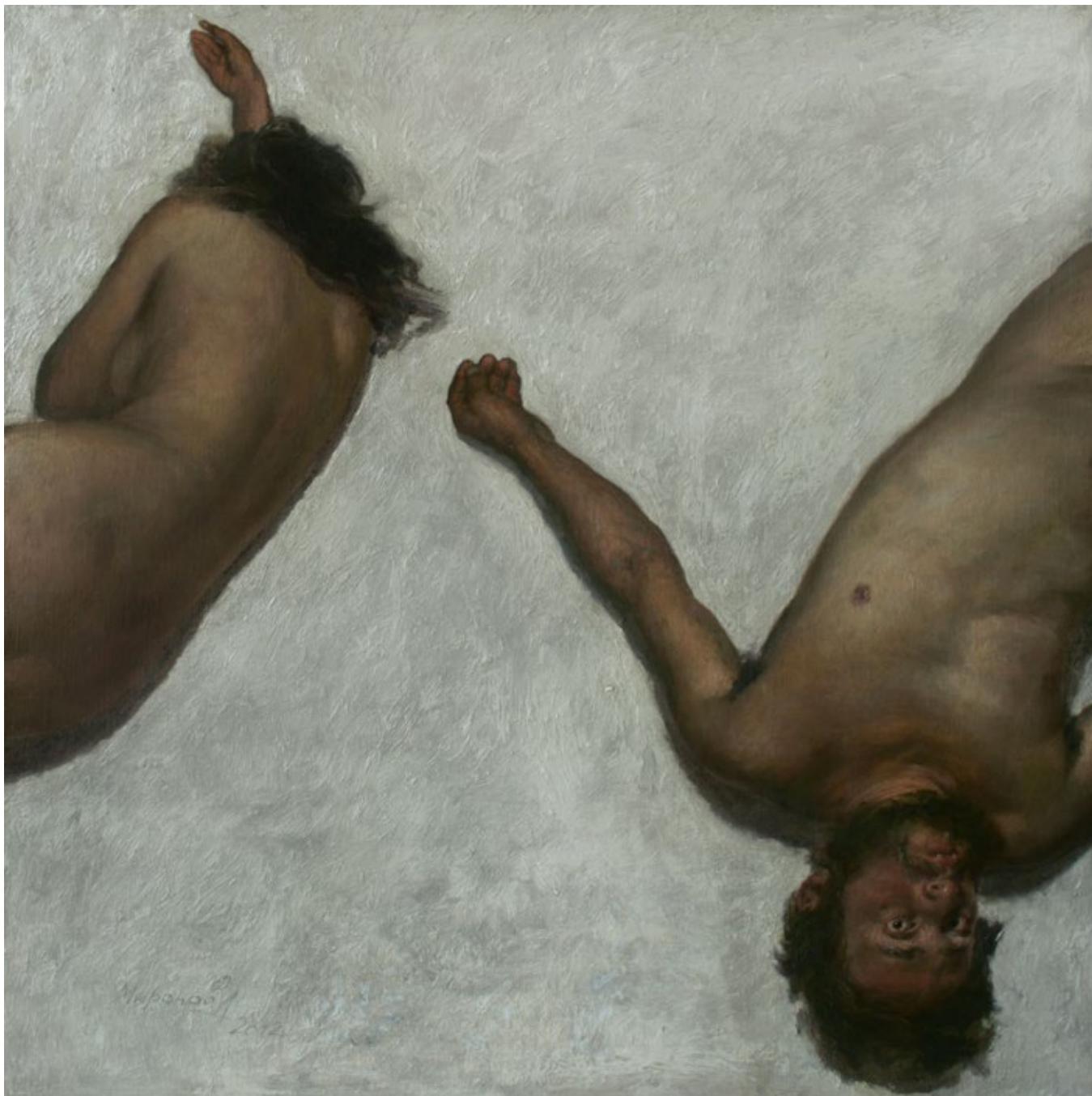
Adam und Eva. Der Sündenfall. 2012. Öl auf Leinwand. Andrey Mironow.

satten, zufriedenen, sich selbst ereignenden Sterben widerspricht der Realität heutiger Selbst- und Fremderfahrungen von Krankheit, Siechtum, Sterben und Tod» (Frank Mathwig).