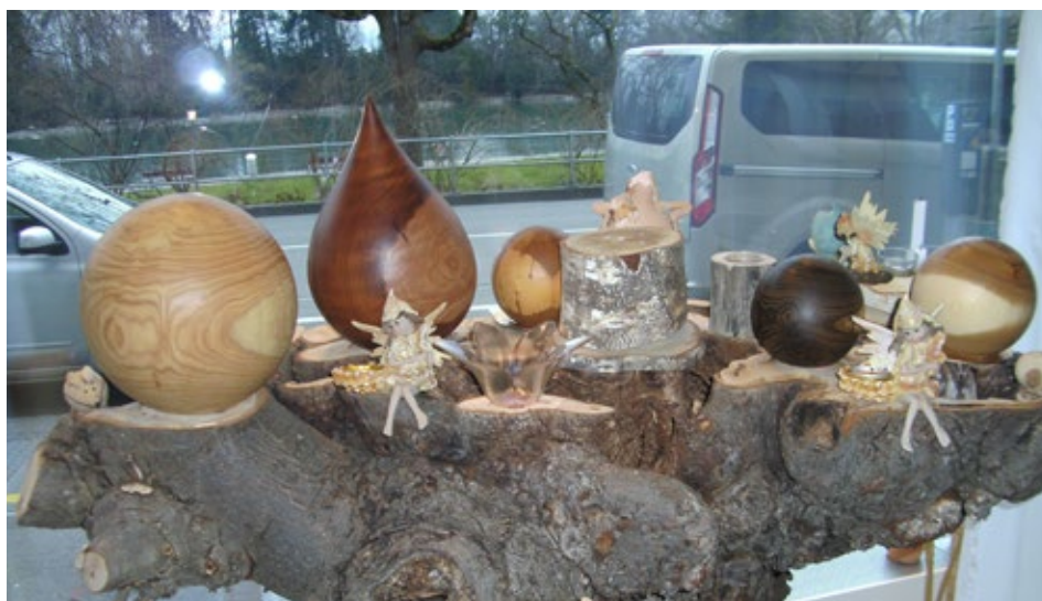
Hölzerne Urnen in einem Schaufenster.

Auch wenn sich die Mehrheit heute noch immer für gemeinschaftsgebundene religiöse Bestattungen entscheidet, so steigt die Zahl von Ritualen, die ausserhalb einer religiösen Gemeinschaft von freien Ritualleitenden durchgeführt werden. 22 Prozent der Schweizerinnen und Schweizer bezeichnen sich als keiner Religion zugehörig. Veränderungen von Todesritualen zeigen sich darin, dass die Angehörigen von den Ritualleitenden dazu ermuntert werden, ganz bewusst die Totenfürsorge selbst zu übernehmen, den Sarg zu bemalen, das Bestattungsritual selbst zu gestalten. Zudem finden sich vermehrt Gedenk- und Erinnerungsfeste, die Neuinterpretationen von religiösen Festen sind und sowohl individuelle als auch kollektive Elemente aufweisen.