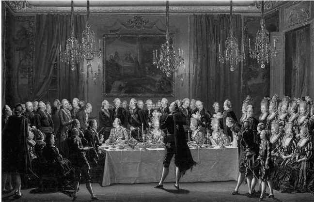
Abb. 3: Le souper de la famille royale, au château de Stockholm le jour de l'An 1779 von Pehr Hilleström, Öl auf Leinwand; Stockholm, Nationalmuseum Drottningholm (Babelon 1993: 181).

Der Schaucharakter der Mahlzeiten wird – in allen drei Abbildungen – noch zusätzlich dadurch betont, dass die Essenden nur auf einer Seite der schwer mit Speisen und Prunkaufsätzen beladenen Tische aufgereiht sind, also kein Gegenüber haben – eine Sitzordnung, die in der U-förmigen Anordnung von Hochzeitstafeln, bei denen das Brautpaar ohne Gegenüber platziert ist, noch bis ins 21. Jahrhundert und in bedeutend weniger hochstehenden Kreisen einen semiotischen Nachhall zeitigt. 19