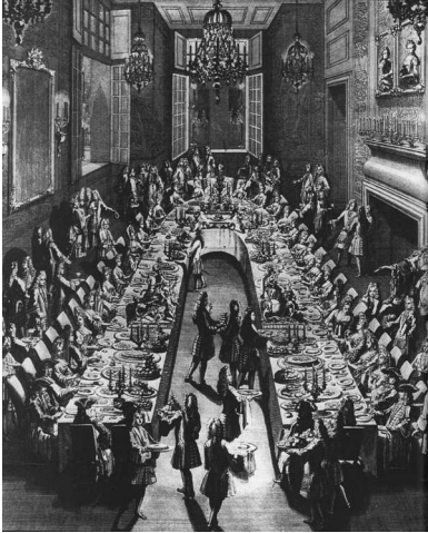
Abb. 1: Bankett für den Herzog von Alba und den Prinzen von Asturien in Paris, 1707 (Freedman 2007: 231).

ten als auch deren Aufführungscharakter in unterschiedlicher Ausformung – vom großen Festbankett bis zum ‚kleineren‘ Essen bei Hofe – illustrieren. 18