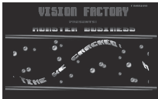
Abb. 2: »Vision Factory presents Monster Business«: Crack-Intro der Gruppe Vision Factory , Commodore Amiga, 1990. Programmdatei archiviert unter ftp://ftp.amigascene.org/pub/amiga/Groups/V/Vision_Factory/VF-Crack/MonsterBusiness , Videoaufnahme einsehbar unter https://www.youtube.com/watch?v=7HZ14KAiBL8 .

auf Aufklebern, T-Shirts und gedruckten Briefköpfen einsetzen. 66 Dabei lag der Ursprung der Crack-Intros zunächst in der Modifikation und Nachahmung von Urheberrechtsvermerken der Programmhersteller. Später wurden daraus komplexe und grafisch anspruchsvolle audiovisuelle Demonstrationen, die mimetisch an Vorspanne von Computerspielen angelehnt waren (Abb. 2). Die Qualität und Einprägsamkeit dieser Vorspanne hing von den Fähigkeiten ihrer Grafiker und Programmierer ab; einige Gruppen etablierten Marken von großem Wiedererkennungswert, wodurch ihre Intros nicht nur in ihrer Funktion, sondern auch in ihrem Erscheinungsbild Markenzeichen glichen und auch als solche von zeitgenössischen Beobachtern interpretiert wurden. 67