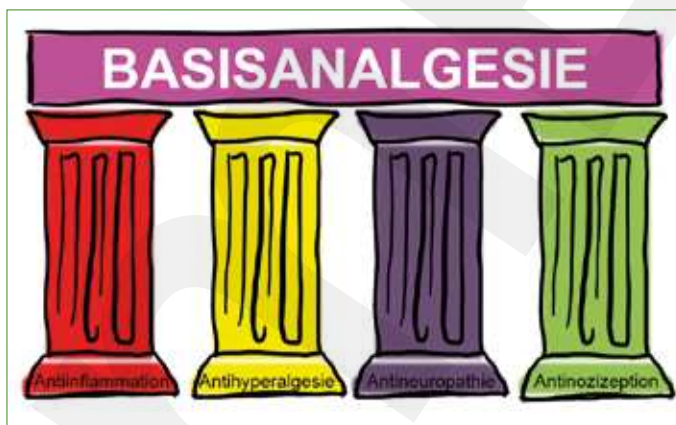
Abb. 1: Das 4-Säulen-Prinzip der Basisanalgesie

Eine weitere wichtige Veränderung der pharmakologischen Therapie von starken Schmerzen in den letzten 20 Jahren ist die Verschreibungspraxis der Opioide. War man früher wahrscheinlich eher zu restriktiv, sind wir heute viel offener geworden in der Indikation von Opioiden. Vor 20 Jahren gab es nur wenige Präparate zur Auswahl, und diese wurden hauptsächlich zur Behandlung von Tumorschmerzen eingesetzt. Die Indikationen zum Einsatz von Opioiden wurden im Folgenden immer mehr ausgeweitet und führten, wie