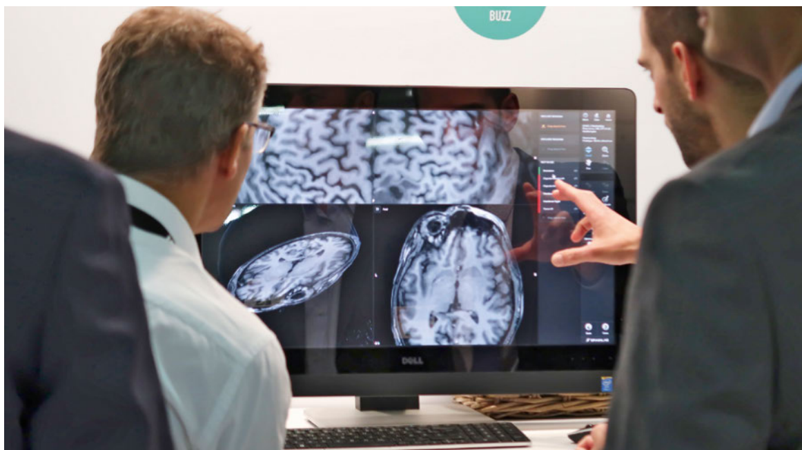
Neurowissenschaftler sollen bereits zu Beginn ihrer Weiterbildung mit Subdisziplinen der klinischen Neurowissenschaften, wie etwa der Neuroradiologie, konfrontiert werden.