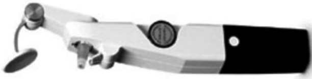
Abb. 3 ◀ Das heute gebräuchliche, 1965 eingeführte Perkins-Tonometer.