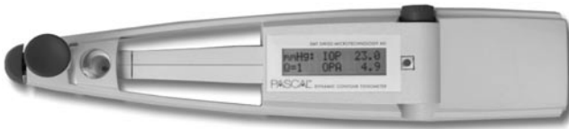
Abb. 5 ◀ Das handgehaltene DCT PASCAL® mit Displayanzeige.