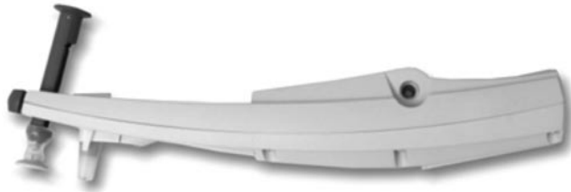
Abb. 6 ◀ Das handgehaltene DCT PASCAL® in Seitenansicht.