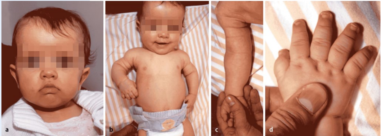
Abb. 6 ▲ Charakteristische klinische Zeichen der Achondroplasie. a, b Faziale Gestalt mit relativer Makrozephalie, prominenter Stirn und Mittelgesichtshypoplasie. b, c Rhizomelie der Arme. d Dreizackstellung der Finger

Wichtige Charakteristika der Achondroplasie sind disproportionierter Kleinwuchs mit rhizomeler Verkürzung der Arme und Beine, relative Makrozephalie, prominente Stirn und Mittelgesichtshypoplasie