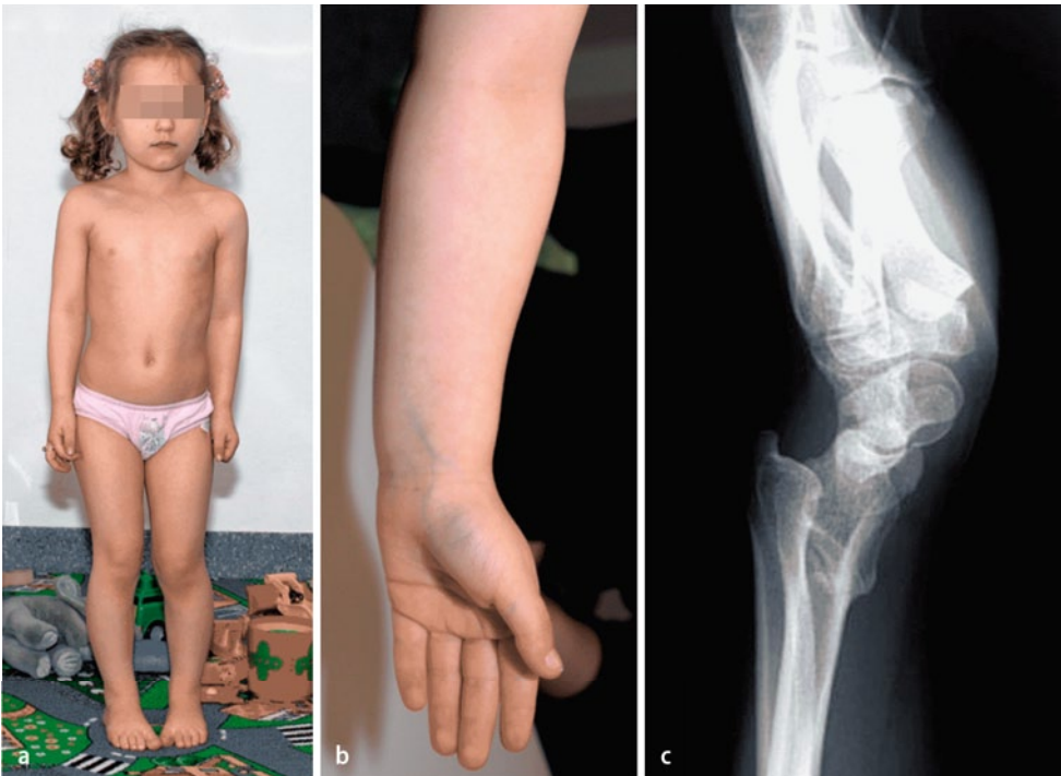
Abb. 3 ▲ Klinische Merkmale der Léri-Weill-Dyschondrosteosis aufgrund eines SHOX-Gendefekts. a Disproportionierter Kleinwuchs mit Mesomelie. b, c Mesomelie und Madelung-Deformität

Differenzialdiagnostisch ist hier besonders das Noonan-Syndrom zu nennen, bei dem der Herzfehler allerdings bevorzugt die rechte Seite mit einer Pulmonalstenose als Kardinalsymptom betrifft. Patienten mit Noonan-Syndrom weisen häufiger eine psychomotorische Entwicklungsverzögerung auf und i. d. R. keine Gonadendysgenese.