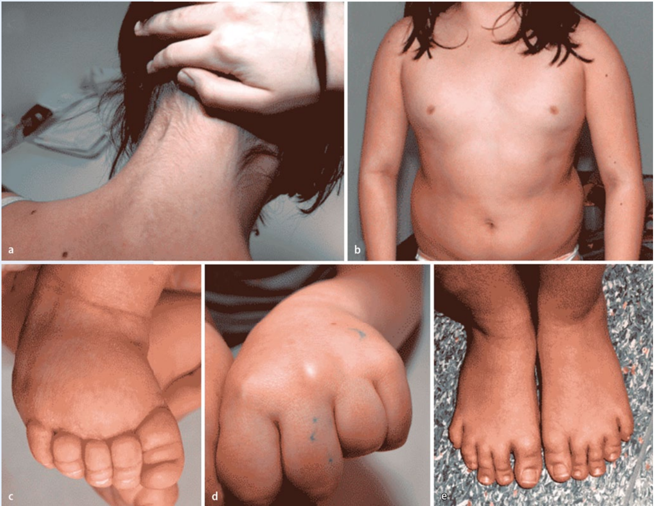
Abb. 2 ▲ Charakteristische klinische Zeichen des Ullrich-Turner-Syndroms. a Tiefer, invertierter Haaransatz, b breiter Thorax, c Fußrückenödeme nach Geburt, d Brachymetakarpie IV und V