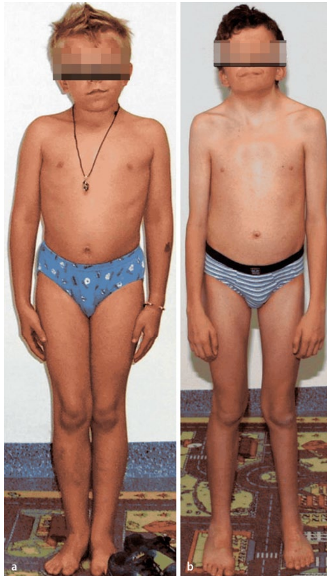
Abb. 5 ◀ Klinische Merkmale des Noonan-Syndroms mit breitem Thorax und leichter Sternumdeformität

bei bis zu 10% der Patienten beobachtet. Die genaue beteiligte Region auf Chromosom 7 ist nicht bekannt. In einzelnen Fällen wurden Deletionen 7q21 und Duplikationen 7p11.2-p12 mit einem Silver-Russell-Phänotyp beobachtet. Bei etwa 30% der Patienten mit dem Verdacht auf ein Silver-Russell-Syndrom bleibt allerdings die genetische Ursache unklar. Retrospektive Untersuchungen ergaben keinen Unterschied im Phänotyp zwischen Patienten mit einer mUPD7 und einer Hypomethylierung 11p15.5. Die ICR1-Hypomethylierung scheint aber in der Mehrzahl eine intrauterine und postnatale Wachstumsverzögerung und eine Asymmetrie zu beinhalten. Eine leichte psychomotorische Entwicklungsverzögerung scheint häufiger bei Patienten mit einer mUPD7 (65%) gegenüber Patienten mit einer 11p15-Hypomethylierung (20%) zu sein. Aufgrund der Variabilität des Phänotyps sollte auch bei Vorliegen einzelner Merkmale eine Diagnostik durchgeführt werden.