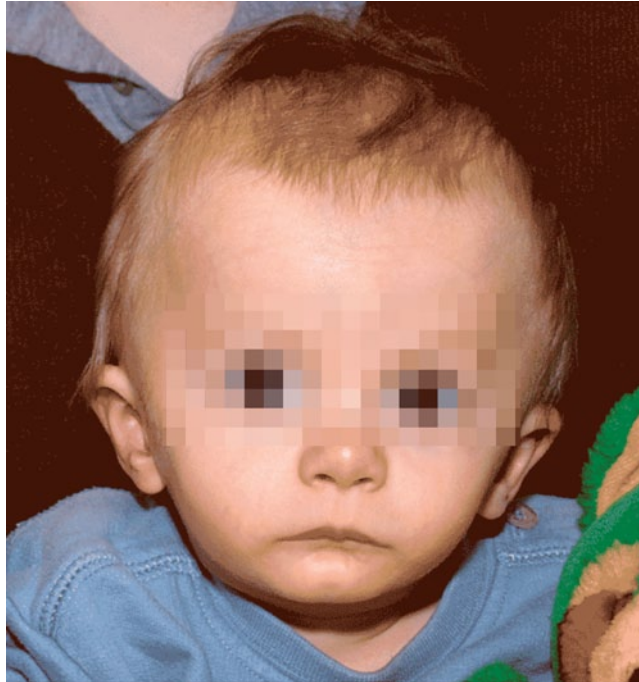
Abb. 4 ► Charakteristische Fazies beim Silver-Russell-Syndrom