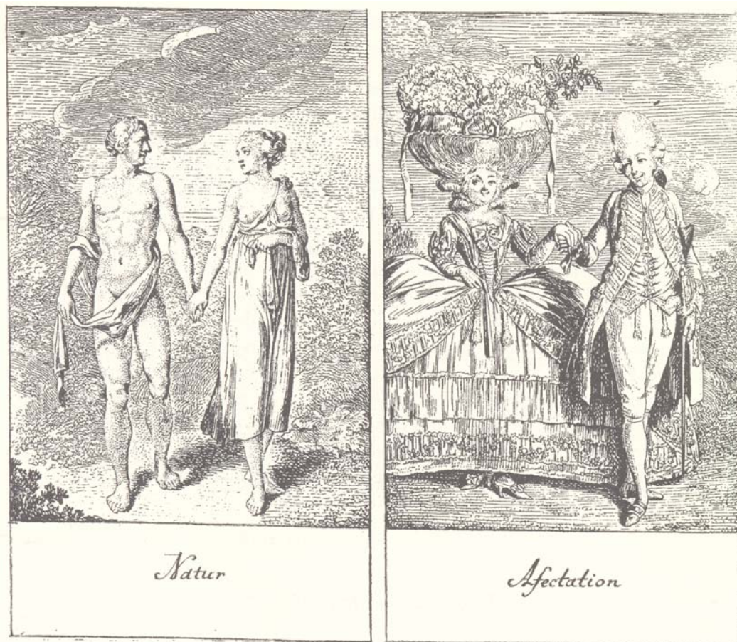
Abbildung 2: Natur und Affectation

Wir haben es hier mit dem Entwurf einer bürgerlichen Kommunikations- und Gesprächskultur im Medium des Bildes zu tun: Was propagiert wird, ist eine auf das "Sich-sehen-und-sich-Verstehen" und damit auf die Reziprozität der Kommunikation hin angelegte Gemeinschaftlichkeit, ist das Ideal der unbedingten Partnerorientierung. Was gleichzeitig diffamiert wird, ist die demonstrative Selbstdarstellung, ist die Orientierung hin auf den Blick eines Betrachters, ist ein kommunikatives Arrangement, das auf die Selbstrepräsentation gegenüber einem Dritten, gegenüber einem Publikum ausgerichtet ist. Dass dieser Gegensatz moralisch aufgeladen ist, machen sowohl Chodowieckis Darstellung als auch die Kommentare Lichtenbergs klar; inwieweit dieses Programm auf einer semiotischen Ebene das zeitgleiche Projekt einer bürgerlichen Öffentlichkeit in spezifischer Weise prägt, wäre zu untersuchen.