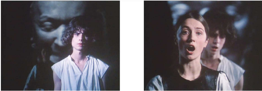
Abbildung 2: Screenshots aus «Parsifal» (D 1982).

Film unter https://youtu.be/7kP_SsItIpU?list=PLeqfv_U4Ybp-4OaZ8ENVMN9ySRRjszpZT&t=1735 .