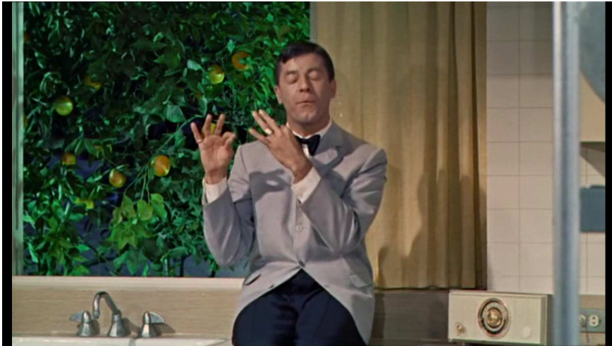
Abbildung 3: Screenshot aus «Cinderella» (USA 1960).

Lewis scheint damit das auszuagieren, was der Psychiater (und Freud-Schüler) Victor Tausk unter dem Stichwort des «schizophrenen Beeinflussungsapparats»