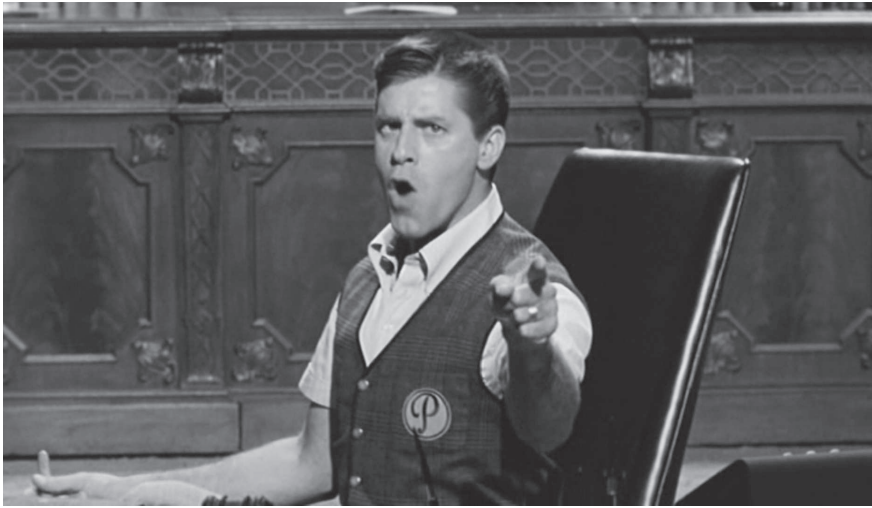
Abbildung 5: Screenshot aus "The Errand Boy" (USA 1961). Clip unter: https://www.youtube.com/watch?v=Q4v8UdkTx30 .

Boy" will Lewis sich als "The Total Film-Maker" beweisen, wie er denn auch sein Buch über die eigene Filmpraxis betitelt hat (Lewis, 1971). Selbstverlust und totale Identifikation, Synchronität und Asynchronität finden in dieser Szene auf verblüffende Weise zusammen: Jerry, wie er da plötzlich von der Count-Basie-Musik der Tonspur überwältigt und fortgetragen wird, ist nicht mehr sich selbst, ist ein Apparat geworden, eine Puppe mit eingebautem Radio sozusagen. Und zugleich kommt Jerry Lewis hier ganz zu sich selbst, als kontrollwütiger Regisseur, als Totalherrscher seines filmischen Universums. Gerade mit seiner Verwandlung in einen Automaten beweist Jerry seine Autonomie. Der Komiker lehrt uns somit in nur einer Szene eine ganze Menge: Nicht nur, dass er die Verfahrensweisen des eigenen filmischen Mediums mit dessen Trennung von Bild und Ton, als auch jene von an den Film angrenzenden Beeinflussungsapparaten wie Radio und Fernsehen reflektiert, er bringt uns über diese Selbstbefragung der eigenen Verfahren auch etwas übers menschliche Subjekt bei: dass dieses zwar unweigerlich gesteuert wird von jenen Beeinflussungsapparaten, mit denen es zu kommunizieren versucht, diese Steuerung aber gerade als Potential genutzt werden kann, um zugleich ein anderer und ganz man selbst zu werden. Oder, wie der Filmtheoretiker Sulgi Lie über Lewis schreibt: