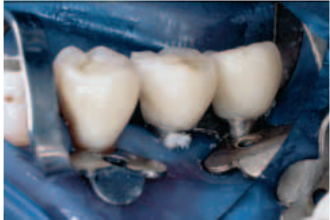
Abb. 8 In der Lateralansicht zeigt sich, wie gut sich die Gingiva an dem natürlichen Zahn und an den polierten Implantathälsen der ITI-Implantate verdrängen lässt. Fig. 8 La vue latérale montre la facilité avec laquelle la gencive se laisse écarter au niveau de la dent naturelle et des collets polis des implants ITI.