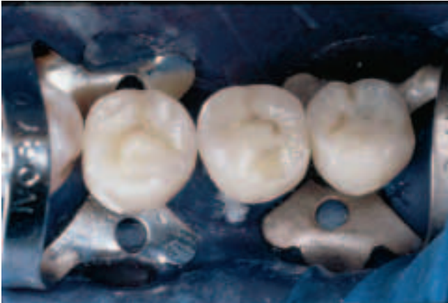
Abb. 7 Nach der Insertion der drei Komposit-Einzelkronen Fig. 7 Après insertion des trois couronnes composites unitaires