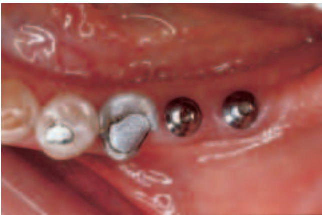
Abb. 2 Klinisch unauffällige Situation nach 3-monatiger Einheilungsphase