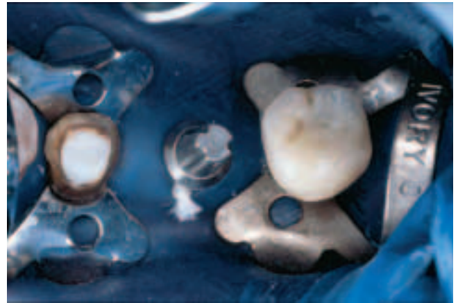
Abb. 6 Die Insertion der silanisierten Kronen auf den ebenfalls silanisierten Implantaten erfolgt einzeln, aus Gründen des besseren Handlings.

Fig. 5 Pose de la digue avec crampons sur l'implant distal et sur le pilier 35 afin d'écartier la gencive de la préparation sousgingivale