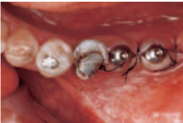
Abb. 1 Transgingival inserierte ITI-Bonefit-Vollschraubenimplantate regio 36 und 37

Abb. 1). Bei diesem System wird nach der Einheilphase (Abb. 2) ein Sekundärteil über eine Konus-Klemmpassung fest mit dem Implantat verbunden. Da bei Einzelkronen kaum der Bedarf einer Verschraubung der prothetischen Versorgung besteht, wird üblicherweise ein 6° konisches Massivsekundärteil der Höhe 4 mm verwendet (Art.-Nr. 048.440, Abb. 3 und 4). Die achsialen Fräsungen dieses Sekundärteils reichen als mechanische Rotationssicherung aus. Eine gegebenenfalls notwendige Nachpräparation des Sekundärteils ist ohne Gefahr möglich (BRÄGGER et al. 1995). Die Abformung erfolgt mit der dazugehörigen Abdruckkappe (Art.-Nr. 048.017), einem konfektionierten, individualisierten Abformlöffel (Baker Rimlock) und Polyätherabformmaterial (Permadyne Penta, Permadyne 2:1, Espe, Seefeld, D). Der Gegenkiefer wird mit Alginat abgeformt (Blue-Print cremix, DeTrey Dentsply, D). Eine arbiträre schädelbezügliche Oberkieferregistrierung wird mit dem Axioquick ATB 370 K-Transferbogen (SAM Präzisionstechnik GmbH, D) durchgeführt. Eine Unterkieferregistrierung, wie sie im Falle einer Stützzenenauflösung vorgesehen ist, war bisher in keinem Fall notwendig. Nach der Modellherstellung werden die Modelle schädelbezüglich in einem SAM 3/ART 550 (SAM Präzisionstechnik GmbH, D) orientiert. Die exakte Montage der Modelle