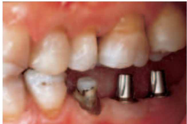
Abb. 4 In der Lateralansicht ist erkennbar, dass die 4 mm hohen und 6° konischen Massivsekundärteile genügend Platz für eine Kronenversorgung lassen.