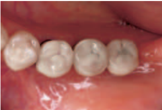
Abb. 9 Okklusalanzeige der Kronen nach 12 Monaten. Aus Gründen der besseren Hygienefähigkeit wurden die beiden Implantate mit Kronen in der Form von Prämolaren versorgt. Fig. 9 Vue occlusale des couronnes après 12 mois. Pour des raisons de facilité d'entretien, les couronnes sur implants 36 et 37 ont une forme de prémolaire.