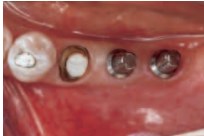
Abb. 3 Massivsekundärteile zur Versorgung der Implantate mit Einzelkronen und Präparation des wurzelbehandelten Zahnes 35