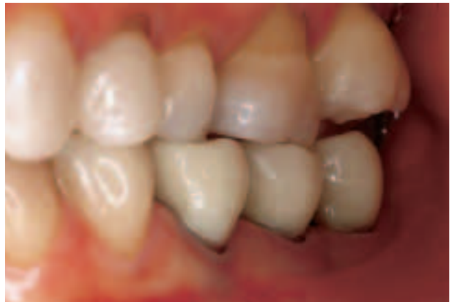
Abb. 10 Lateralansicht der Rekonstruktion nach 12 Monaten Fig. 10 Vue latérale de la reconstruction après 12 moi