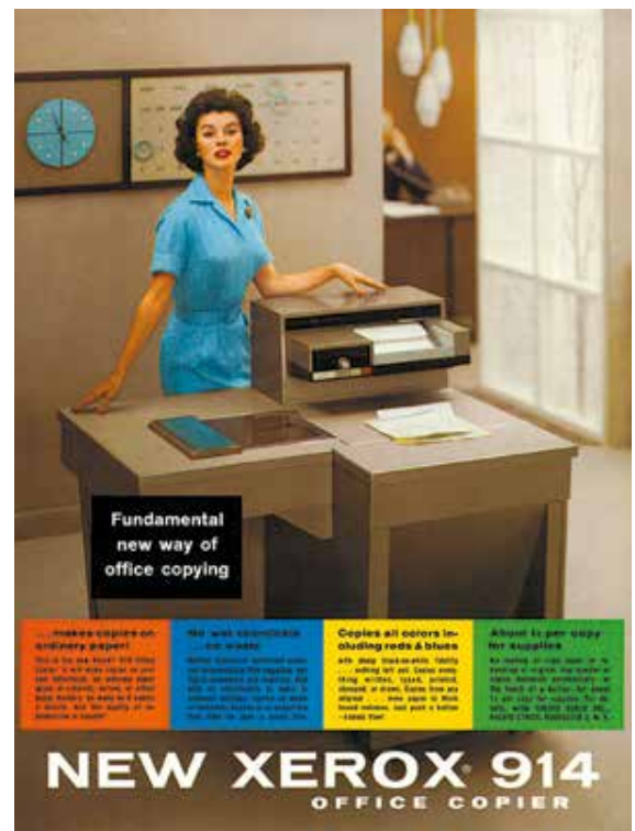
6. Brochure publicitaire présentant le Xerox 914, 1959.

Assurer la maintenance de la machine ne consisterait pas seulement à la manier, mais, bien davantage, à la traiter avec sollicitude. L'appareil est anthropomorphisé : il doit être bichonné, renferme des secrets et nécessite d'être contrôlé car il fait peser sur le bureau une menace de désorganisation. Le journaliste médite aussi sur le nouveau champ professionnel que l'esprit de Xerox a fait naître pour les femmes : « Les filles qui utilisaient les typewriters [machines à écrire] étaient elles-mêmes appelées typewriters [littéralement, celles qui écrivent les caractères typographiques]. Mais, par chance, personne n'appelle les opératrices de Xerox les « xeroxes » 37 . »