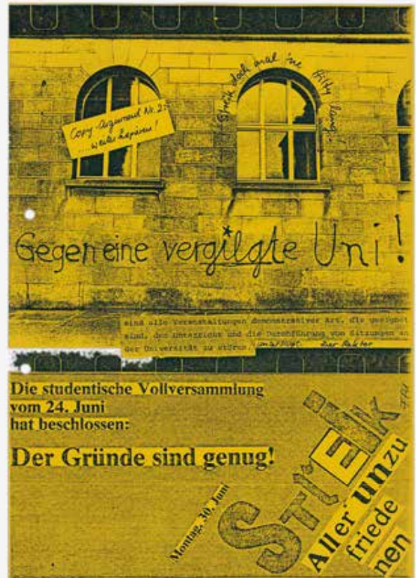
9-12. Couvertures des numéros 1, 2, 3 et 11 de Copy-Argument. Weiterkopieren, 1980. Zurich, UZH Archiv (PA.001.196).