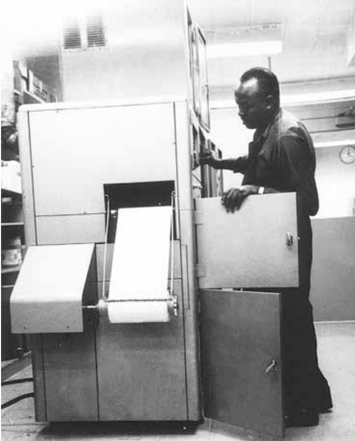
4-5. Les employés de la US National Library of Medicine de Bethesda manipulant un photocopieur Xerox, circa 1969, tirages argentiques. Bethesda (MD), US National Library of Medicine.