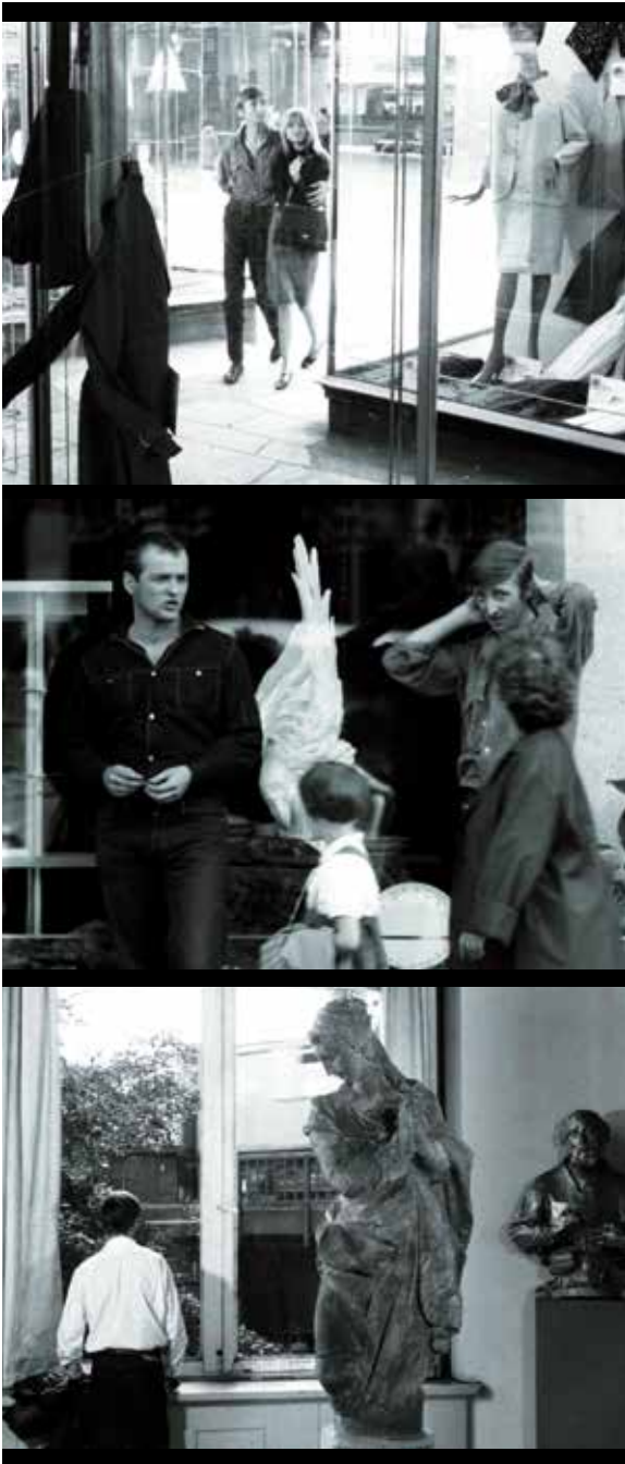
Abb. 3 a-c: Unterwegs in der Stadt - Ost

titel: JAHRGANG 45. Damit eröffnet sich ein weiterer Aspekt der Gemeinsamkeit: Hier wie dort geht es auch darum, was diese Angehörigen der ersten Nachkriegsgeneration noch von jener Geschichte wahrnehmen, deren Spuren sie allgegenwärtig – teils ostentativ präsentiert – umgeben. Der Erfahrungs- und Verhaltensunterschied zwischen den Jungen und den Angehörigen der älteren Generation wird in beiden Fällen auch explizit angesprochen. Freilich geschieht das sehr