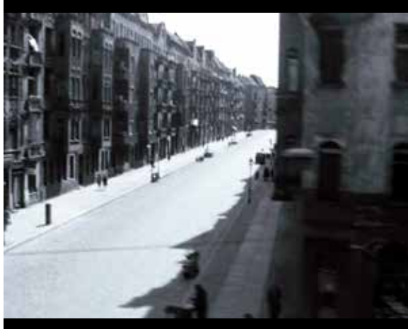
Abb. 1: Fahraufnahme der Häuserfront in der Schönhauser Allee

Lisa noch ein Eis essen zu wollen, Ambivalenz zeigt. Nachdem Lisa ausgestiegen ist, wendet sich die Kamera vollkommen von Al ab, und die in einer spürbar langen Einstellung vorbeiziehenden Fassaden der Schönhauser Allee mit den Einblicken in die – noch nahezu autofreien und baumlosen – Nebenstraßen, lediglich vom Fahrgeräusch der U-Bahn begleitet, fordern für einige Zeit unsere ausschließliche Aufmerksamkeit. (Abb. 1)