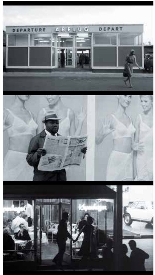
Abb. 2 a-c: Unterwegs in der Stadt – West

Beide hier zur Rede stehenden Filme präsentieren in diesem Sinne die Straße fragmentarisch als eigentlichen roten Faden, als Ort des Zufälligen, Beiläufigen, manchmal nur als Hintergrund, der aber doch eingreift in die Bewegung der Figuren und der vor allem die Blicke der Zuschauenden auf sich ziehen kann. Selbst wenn für eine Weile gewisse »visuelle Komplexe« vertieft werden, so nehmen beide Filme uns in den filmischen »Fluss des Lebens« hinein, der von der Zielrichtung der erotischen Karriere-story um Alexandra für lange Phasen ebenso weg drängt wie von der Entwicklungsgeschichte um Al, sondern auf völlige Präsenz hinausläuft. Im-