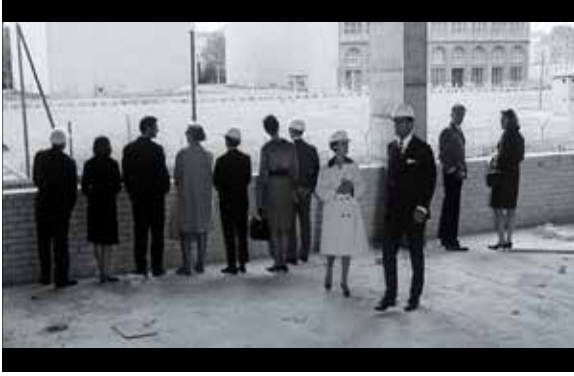
Abb. 6: Besuchergruppe blickt in PLAYGIRL vom Springer-Haus über die Mauer, Richtung Gendarmenmarkt

rechter Hand ragt die Ruine des Schinkelschen Schauspielhauses ins Bild. Die drei reden, abgesehen von einer anfänglichen Bemerkung, nicht weiter über den Ort, sondern über flüchtige Begegnungen mit Frauen auf der Straße oder im Park, kurze Momente, die ihre Imagination in Gang setzten. Der Dritte versucht einen Witz, der aber misslingt. Wenn also die Reflexion der Figuren über den Ort, an dem sie sitzen, auch hier sehr begrenzt bleibt, so lädt der Film doch selbst durch das lange Verweilen bei der Totale des Platzes, durch deren Entkopplung vom Dialog, durch die Abwesenheit jeder Filmmusik sowie durch einen langsamen 90°-Schwenk zur Reflexion über den Ort ein, in den sich mit den allgegenwärtigen Kriegsspuren Geschichte eingeschrieben hat.