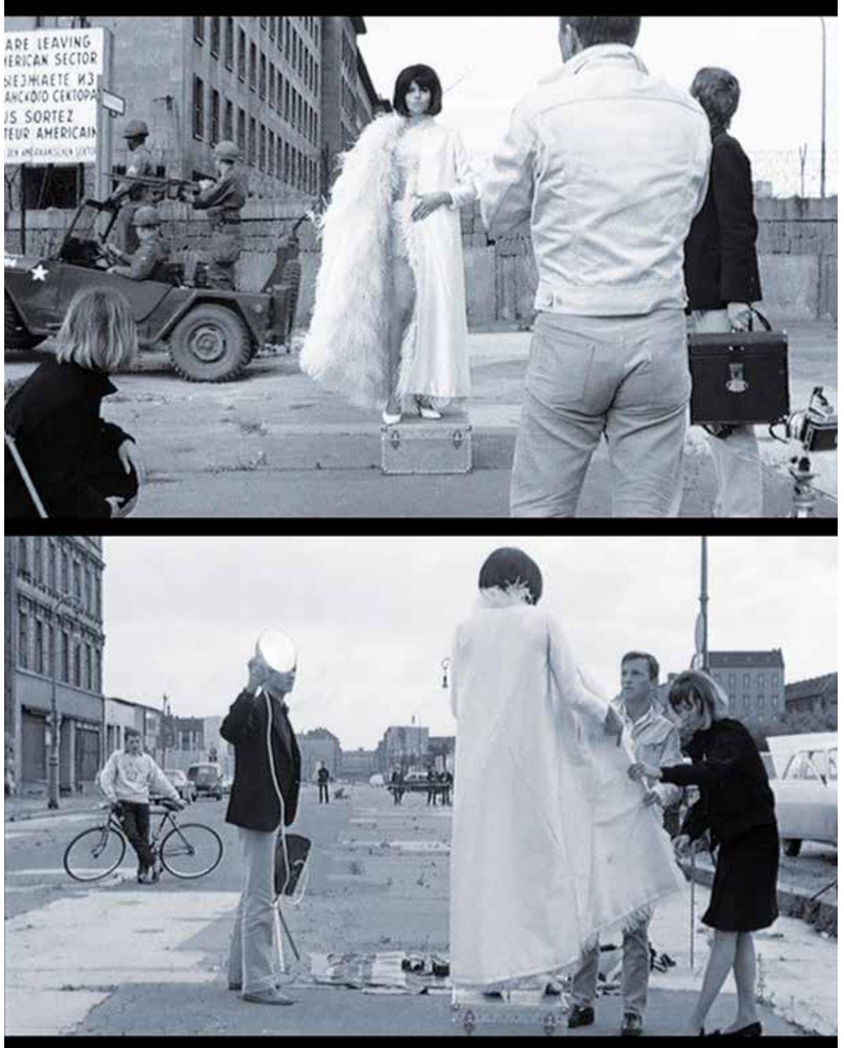
Abb. 4 a-b: Szenerie an der Wilhelmstrasse, Schuss und Gegenschuss

Uns im Kino, als imaginären Flaneuren, geben diese Bilder – zumindest potentiell – mehr zu sehen als den Figuren. Sie verraten viel über den für den Film sorgfältig ausgewählten grotesken Ort des Kalten Krieges. Wer den Standort an der Wilhelmstraße erkennt und von seiner historischen Dimension weiß, sieht, wie zerstückelte Sedimente der Geschichte dort einander spektakulär überlagern. Der ins Bild gesetzte zerborstene und notdürftig geflickte Asphalt der Straße weist noch die Spuren des Krieges auf.