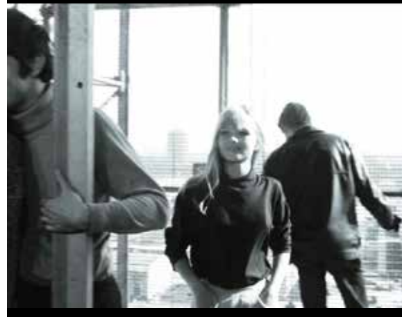
Abb. 8 a-c: Ausflug in die Neubauwelt-Ost

denfalls mit Blick auf den Mitte der 1960er-Jahre in der DDR herrschenden Diskurs. Nahezu alle anderen Verbotensfilme berufen sich direkt oder indirekt auf die große Erzählung vom ›historischen Sinn‹ des Sozialismus. Sie nehmen den Mythos gleichsam beim Wort, um sich von dieser Position aus kritisch mit realen Entwicklungen in der DDR auseinanderzusetzen. Noch in ihrer kritischen Dimension bezogen sich alle anderen 1965/66 verbotenen DDR-Filme mit hin auf das verbindliche ideologische Obdach. Das nicht selten von den Figuren explizit artikuliert Ziel ist ein verbesserter Sozialismus. Böttchers Film dagegen lässt sich schlicht und einfach auf diese große historische Sinnkon-