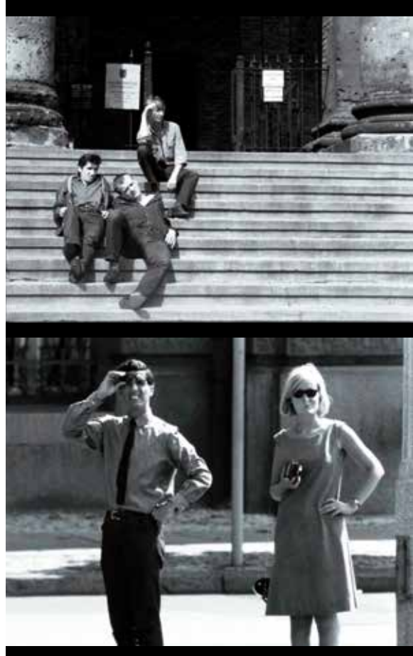
Abb. 7 a-b: Konfrontation der Blicke auf dem Gendarmenmarkt

Von Will Tremper, der PLAYGIRL in Eigenproduktion mit geliehenem Geld gedreht hat, zog sich der Verleih nach einer ersten Sichtung des