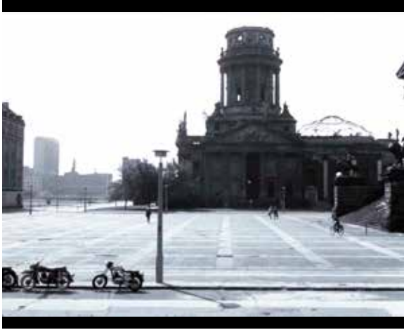
Abb. 5: Totale des Gendarmenmarkts, Springer-Hochhaus hinten links

lich macht: The Redemption of Physical Reality . Wir schauen heute, medial vermittelt, in die Welt von gestern. Freilich kann man nur noch partiell und dazu in medialer Transformation deren Oberfläche habhaft werden und nicht der prinzipiell abwesenden Vergangenheit selbst. Aber die immer wieder neu zu lesende (möglichst nicht eigens inszenierte) Oberfläche der Welt war das, was Kracauer interessierte. Und natürlich sehen wir sie heute auf andere Weise als die damaligen Zeitgenossen. Das betrifft auch den retrospektiven Blick einstiger Zeitzeugen: Der inzwischen veränderte Blick lässt die Eigentümlichkeit der hier aufgezeichneten urbanen und teils auch der psychologischen Räume von gestern stärker, klarer und neu gewichtet hervortreten, auf jeden Fall: anders als man sie damals wahrnahm. Die schon angesprochenen Einblicke in die noch baumlosen, nahezu auto- und geschäftsfreien Nebenstraßen der Schönhauser Allee in JAHRGANG 45 sind nur ein Beispiel dafür. Gerade die wahrnehmbare Differenz, das Fremdgewordene stärkt das filmische Potential für unsere Beobachtung umso mehr. Hinzu kommt die Färbung der Wahrnehmung, wenn wir inzwischen das ›Danach‹ der Orte kennen.