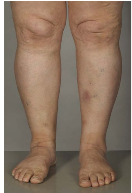
Abb. 2 ▲ Erythema nodosum am linken Unterschenkel einer 76-jährigen Patientin mit Colitis ulcerosa

Patienten mit VTE sind älter als solche ohne VTE. Rund 10–20% der Krankenhauspatienten können sekundär eine VTE entwickeln [47, 48]. Grundsätzlich sollten CED-Patienten über VTE-Risikofaktoren wie die Verwendung von oralen Kontrazeptiva und Immobilisation im Rahmen von Flug- oder Busreisen aufgeklärt werden.