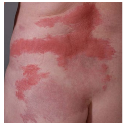
Abb. 3 ▲ Sweet-Syndrom, tieflumbal links, bei einer 56-jährigen Patientin mit M. Crohn