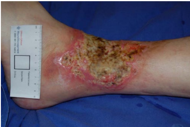
Abb. 1 ◀ Pyoderma gangraenosum am linken Fuß eines 50-jährigen Patienten mit M. Crohn

gen Verlauf positiv beeinflussen. Durch eine orthotope Lebertransplantation wird ein gutes Outcome bei Patienten mit einer PSC im Endstadium ermöglicht [34].