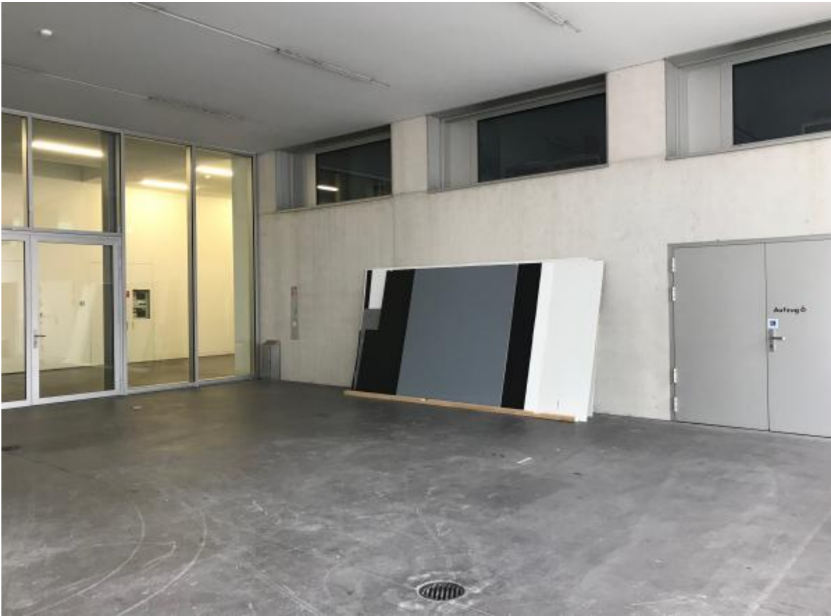
Umbauarbeiten im Löwenbräukunst Zürich, April 2019, Foto: Pablo Müller

In den 1990er Jahren kam es in Zürich zu einem sogenannten Kunstwunder:[1] [b-n-l-de/dead-end/pdf#a2] Zahlreiche Galerien entstanden, die Kunsthalle kam dazu, das Migros-Kulturprozent lancierte ein eigenes Museum, und unzählige, selbstorganisierte Kunsträume prägten die Zürcher Kunstszene. Vor allem das 1996 gegründete Kunstkonglomerat auf dem Areal der ehemaligen Brauerei Löwenbräu und die, nach einer programmatischen Neuausrichtung, äusserst kontrovers aufgenommene Shedhalle erhielten internationale Aufmerksamkeit. Sie bildeten zwei Pole in der sich damals neu formierenden Zürcher Kunstszene: das Löwenbräu-Areal mit seiner Kunstmarkt-Nähe auf der einen und die Shedhalle mit ihrem politischen Programm auf der anderen Seite.