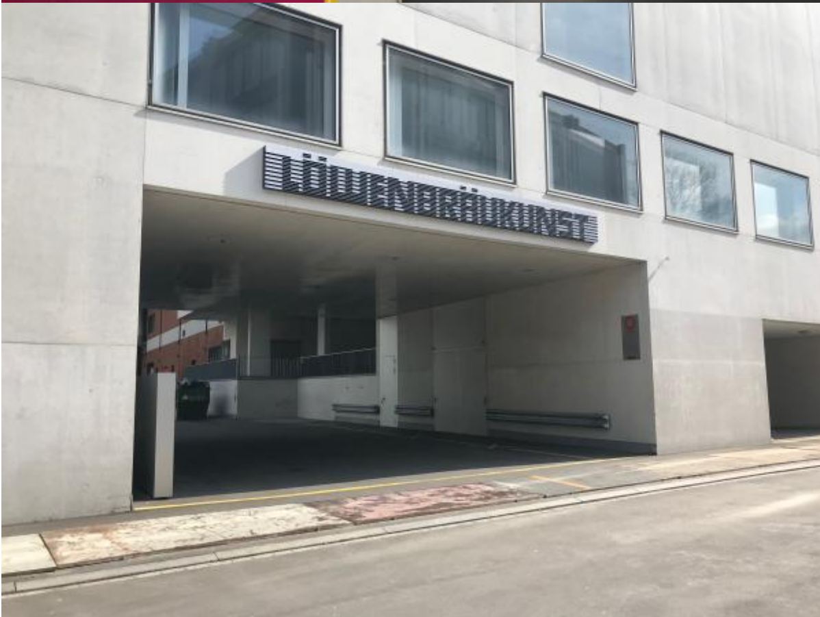
Umbauarbeiten im Löwenbräukunst Zürich, April 2019, Fotos: Pablo Müller

Von der damaligen Vitalität ist heute nichts mehr zu spüren. Die Shedhalle, aktuell interimistisch geleitet, lädt jeweils am letzten Donnerstag im Monat zum Leichenmahl ein. Bei diesen (semi-)öffentlichen Treffen diskutieren Gäste und weitere Interessierte über Leistungsvereinbarungen, Budgets und andere Rahmenbedingungen, und fragen, welche Aspekte der Shedhalle man besser sterben lassen sollte und für welche sich ein Weiterleben