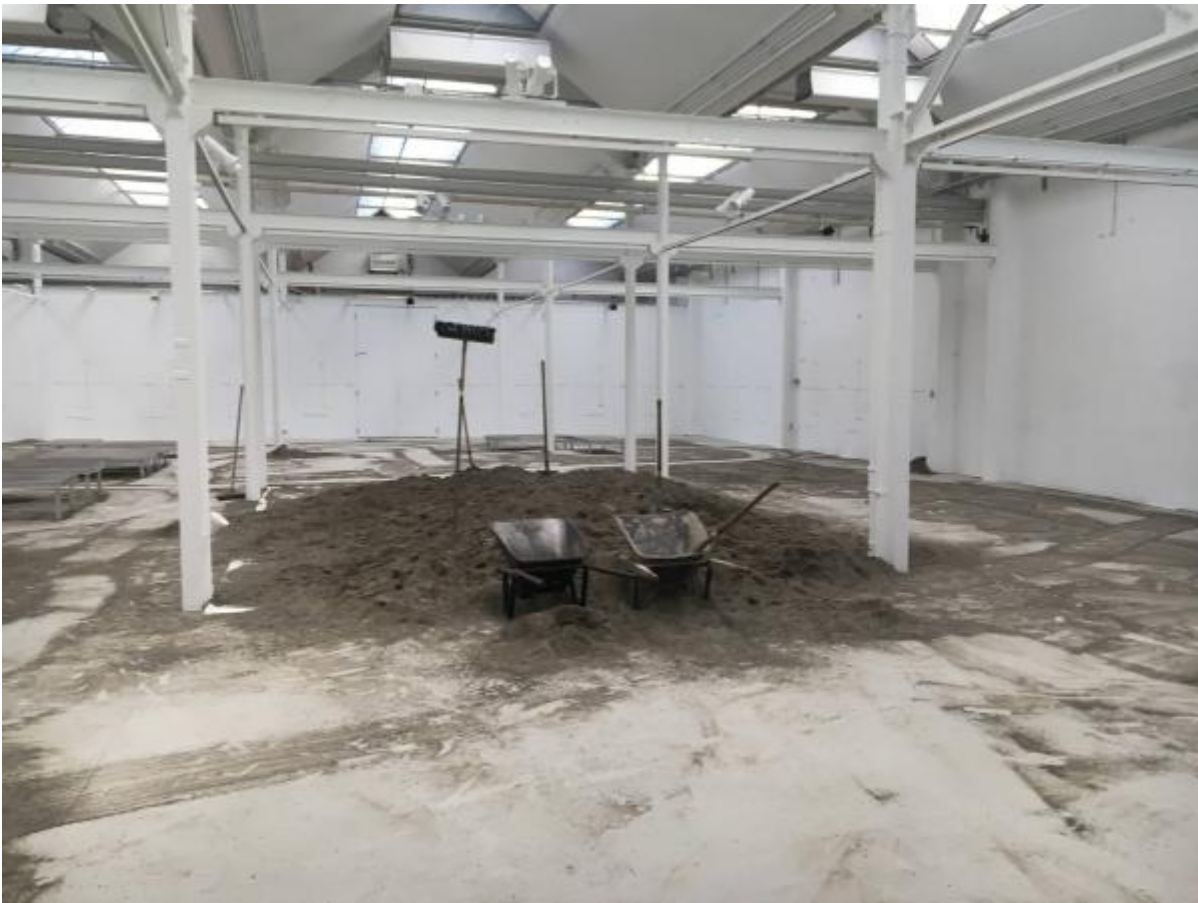
Ausstellungsprojekt 13 m 3 Sand - Ihr bringt die Schaufeln, wir haben den Sand , Shedhalle Zürich, 2019, Fotos: Shedhalle Zürich

Bei der Shedhalle verhedderte sich die Institution in den letzten Jahren in einer Beschäftigung mit sich selbst: Anhaltende Spannungen und Wechsel in der kuratorischen Leitung, eine ungünstige interne Arbeitsteilung und Differenzen mit der Stadt Zürich wurden begleitet von Diskussionen darüber, wie sich die in den 1990er Jahre entwickelte gesellschaftskritische Vermittlungspraxis in die Gegenwart übersetzen liesse. Diese von den Beteiligten durchaus kritisch gedachte Selbstreflexion führte allerdings zu einer Stilisierung der 1990er Jahre und mündete in selbstauferlegte Normierungen. Besonders augenscheinlich wird diese unproduktive Selbstbezogenheit am von 2014–2017 aufgearbeiteten und schliesslich online gestellten Shedhalle-Archiv[ https://archiv.shedhalle.ch/ ]. Schlüsselbegriffe der kuratorisch-künstlerischen Ausstellungsprojekte der 1990er Jahre – sie reichen von Geschlechterpolitik über Pop Culture bis zu Technologiekritik – werden dort unkritisch in die Archiv-Ordnung übernommen. Gleichzeitig ist dieses eigentlich an eine interessierte Öffentlichkeit gerichtete Online-Archiv aufgrund der unübersichtlichen Gliederung und umständlichen Struktur kaum sinnvoll nutzbar. Dies führt zu einem Paradox: Das eigentlich gegen aussen gerichtete, für ein produktives Weiterdenken gedachte Archiv wird zu einem Sinnbild für institutionelle Verengung und Stillstand.