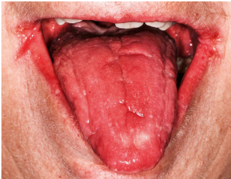
Abb. 2 Erythematöse Candidiasis der Zunge mit Mundwinkelrhagaden

Areale gekennzeichnet (Abb. 2). Differenzialdiagnostisch muss an Malnutrition, Reizung durch exogene Faktoren und leukoplakische Schleimhautveränderungen wie den oralen Lichen planus gedacht werden (FARAH ET AL. 2010).