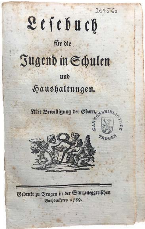
Titelseite und Vorrede des «Lesebuch[s] für die Jugend in Schulen und Haushaltungen». Das «mit Bewilligung der Oberr.» herausgegebene Buch wurde 1789 in Trogen bei Kalendermacher Sturzenegger erstmals gedruckt und erschien in der Folge bis 1833 in sechs Auflagen.