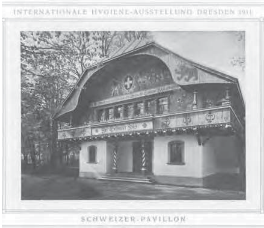
Abb. 1: «Schwarz-Weiss-Fotografie, die den Schweizer Pavillon an der IHA in Dresden 1911 zeigt», in: Schweizerisches Gesundheitsamt/Schweizerisches Landeskomitee (Hrsg.), Internationale Hygiene-Ausstellung. Dresden 1911. Die Schweizerische Abteilung. Katalog und Kommentar über die wichtigsten Gebiete der öffentlichen Gesundheitspflege in der Schweiz (Bern 1911) Einlageseite ohne Nummerierung

an der Exposition Universelle de Paris (1900). An diesen beiden Veranstaltungen wurden sogar ganze Villages Suisses errichtet. Es wurden wie im Pavillon der IHA technischen Errungenschaften der Schweiz im Innern von Pavillons mit folkloristischem Äusseren präsentiert. 133 Im Vergleich zu den genannten Ausstellungen fiel der Schweizer Pavillon an der IHA klein aus.