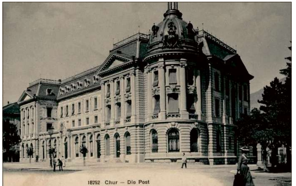
1872 Chur – Die Post