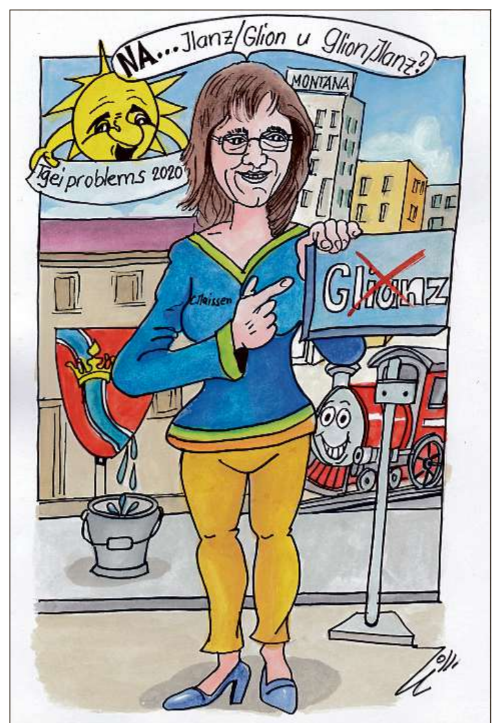
CARICATURA L. FLEPP