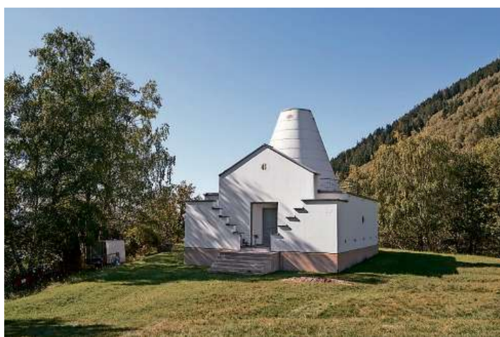
Gegensatz zur Natur: Die Kapelle steht da wie das verkleinerte Modell einer grossen Kirche; weiss, spielerisch komponiert.