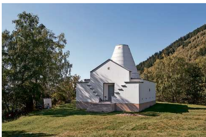
Gegensatz zur Natur: Die Kapelle steht da wie das verkleinerte Modell einer grossen Kirche; weiss, spielerisch komponiert.