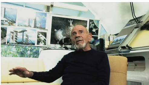
Abb. 1 Jacque Fresco in seinem Atelier

Das Venus Project, benannt nach seinem Standort in Venus, Florida, versteht sich als "a comprehensive plan for social reclamation". Hinter dem Vorhaben stehen der 2017 im Alter von 101 Jahren verstorbene Autor und Erfinder Jacque Fresco und dessen Partnerin Roxanne Meadows, die seit Jahrzehnten eine radikale gesellschaftliche Neu-Organisation propagieren (vgl. Abb. 1 und 2). Fresco entstammte ursprünglich der US-amerikanischen Technokratiebewegung, die in den 1930er-Jahren eine kurze Phase großer Popularität erlebte. 5