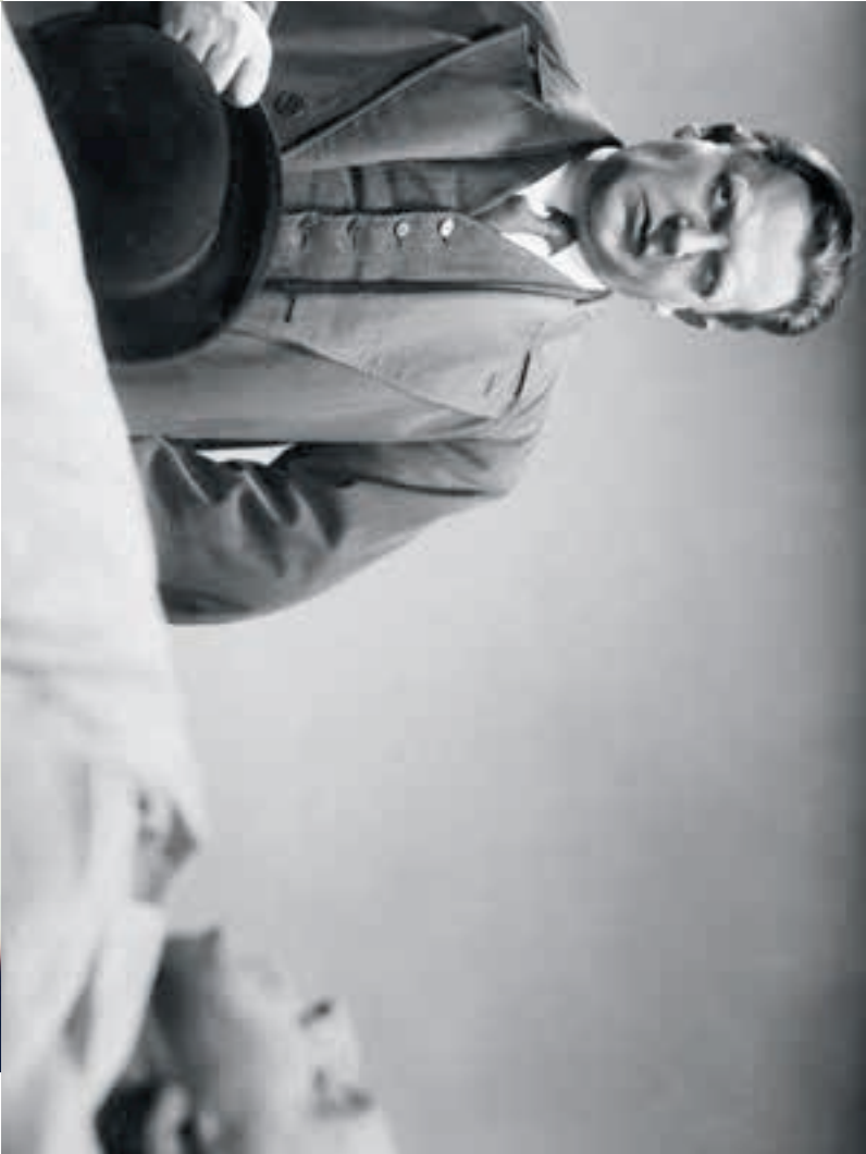
M – Eine Stadt sucht einen Mörder (1931)