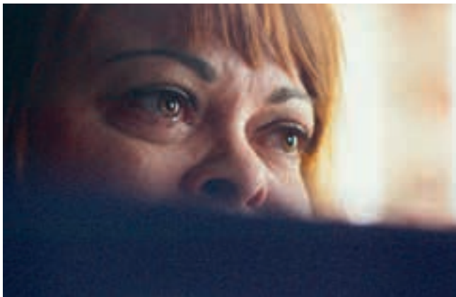
Don't F**k with Cats (2019)