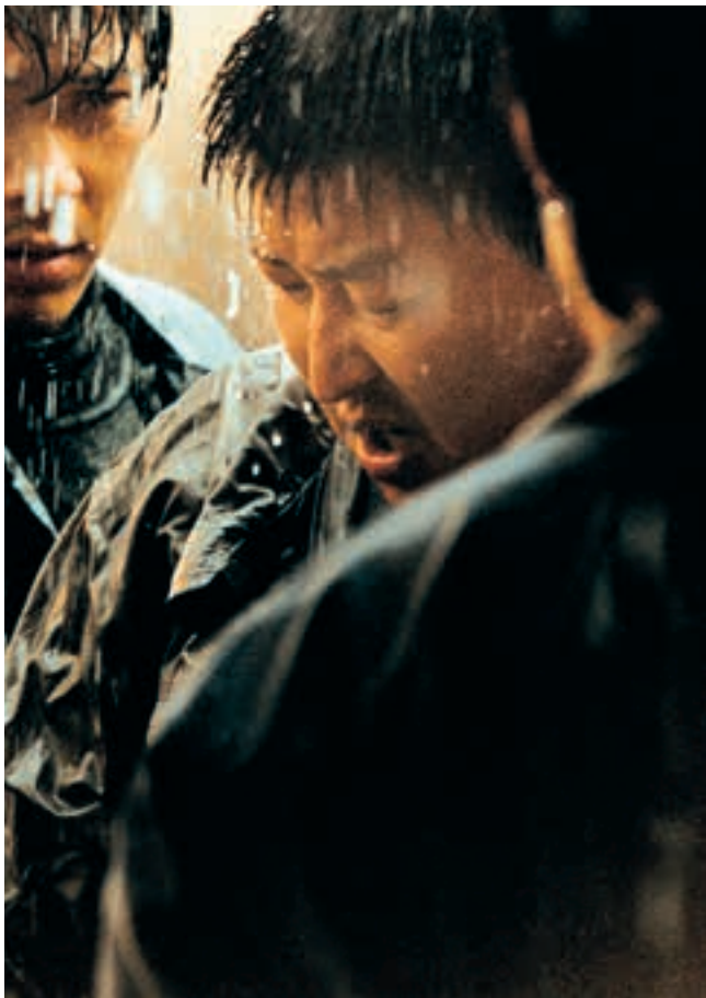
Memories of Murder (2003) Regie: Bong Joon-ho