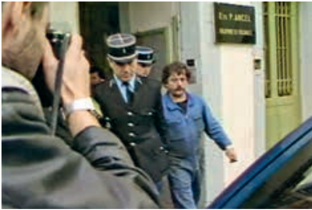
Grégory (2019) Regie: Gilles Marchand, Anna Kwak Sialelli