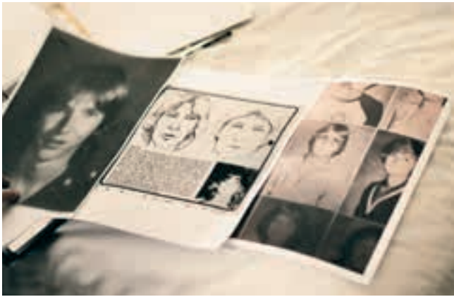
The Innocent Man (2018) Buchvorlage: John Grisham