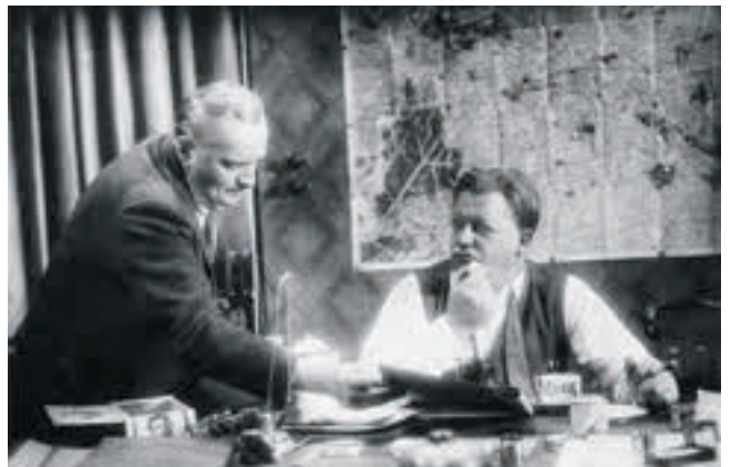
M – Eine Stadt sucht einen Mörder (1931) Kamera: Fritz Arno Wagner