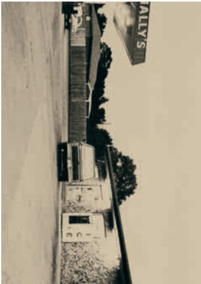
The Innocent Man (2018) Kamera: Nicola Marsh