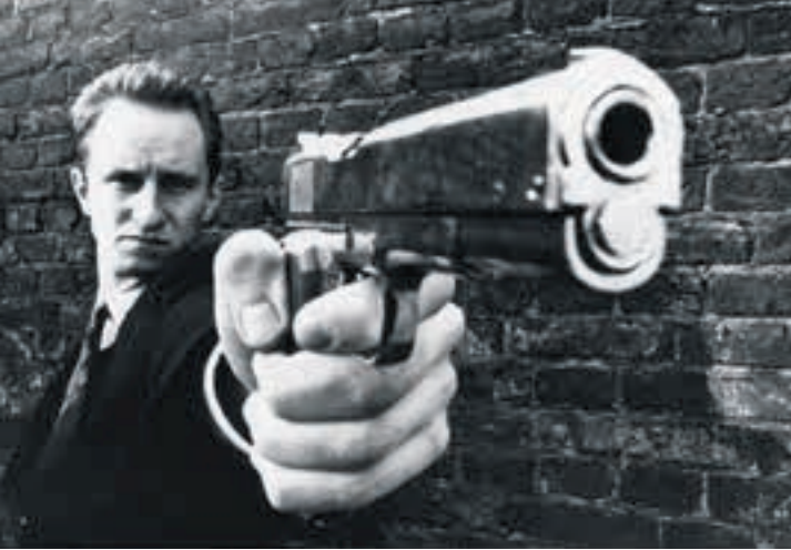
C'est arrivé près de chez vous (1992) Kamera: André Bonzel