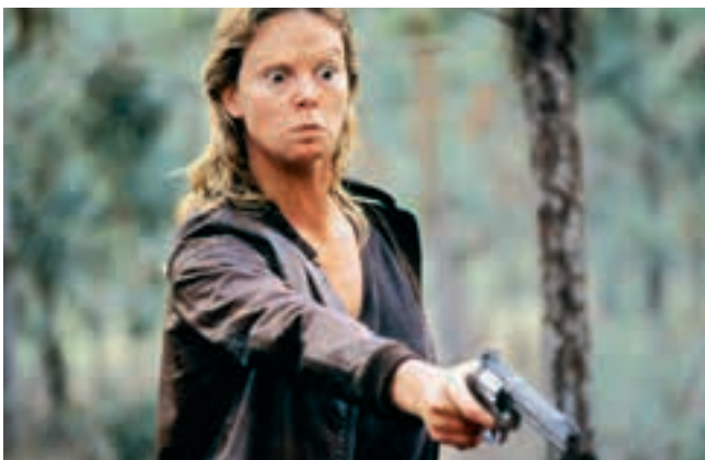
Monster (2003) mit Charlize Theron