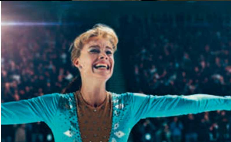
I, Tonya (2017) mit Margot Robbie