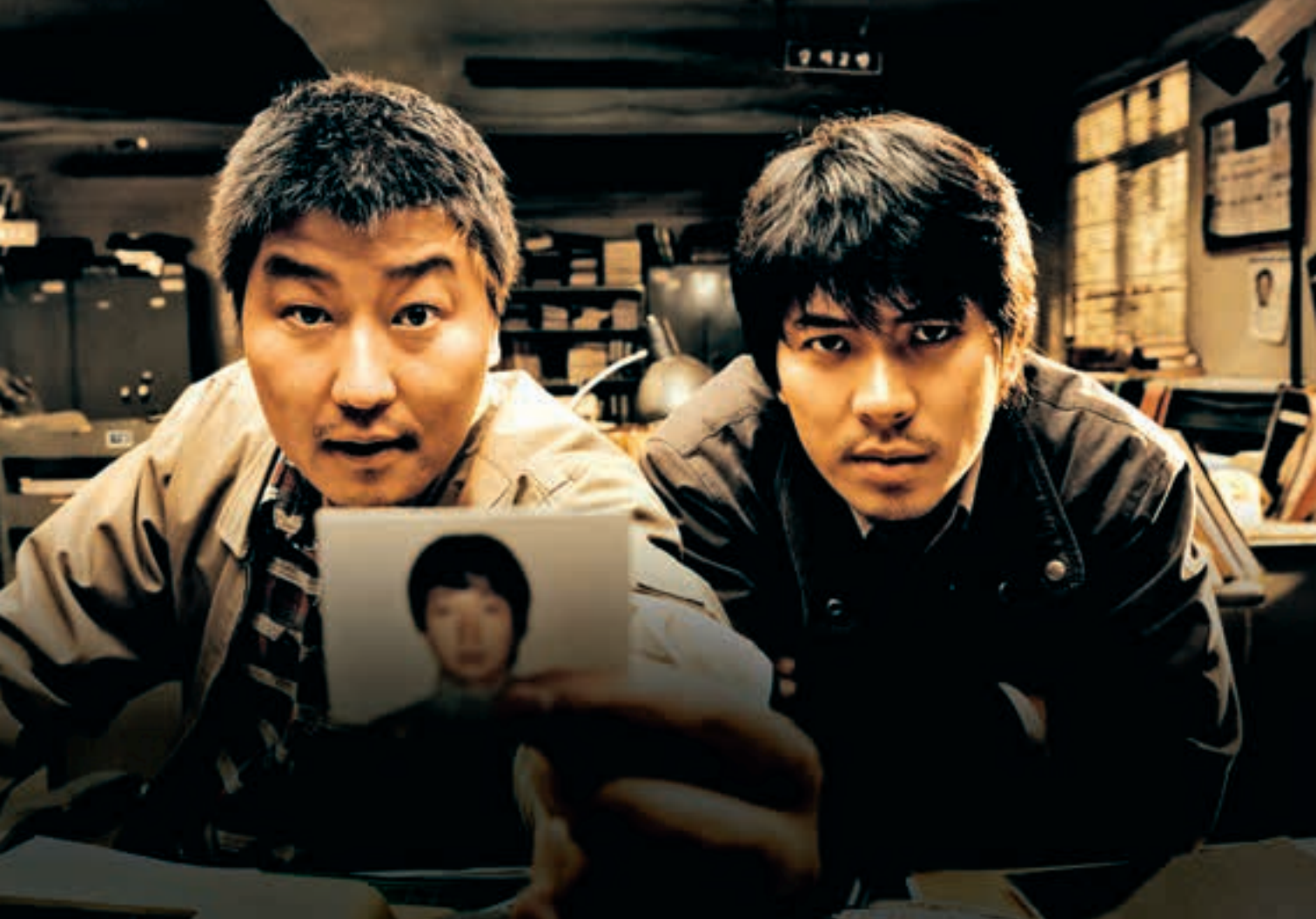
Memories of Murder (2003) mit Kang-ho Song