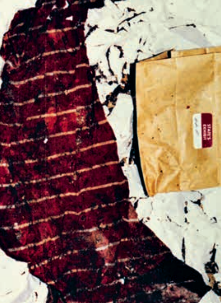
The Innocent Man (2018) Produktionsdesign: Lauren Meyer