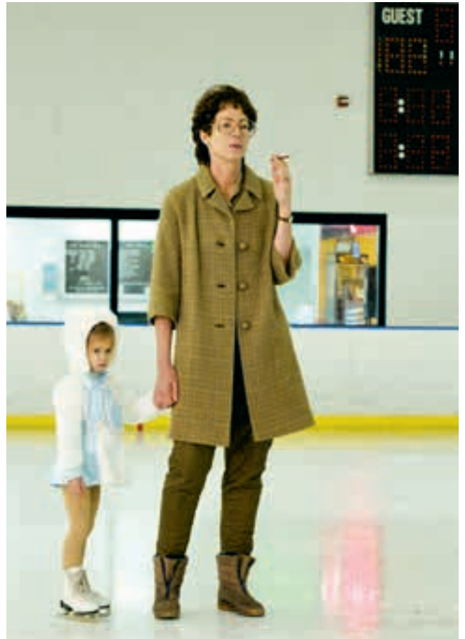
I, Tonya (2017) Drehbuch: Steven Rogers