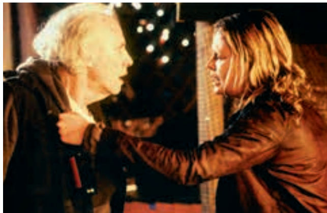
Monster (2003) Regie: Patty Jenkins