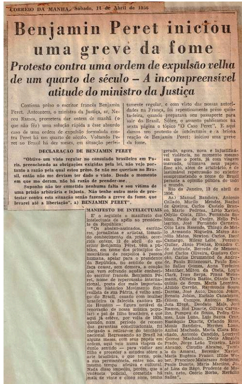
Fig. 1 – Correio da Manhã , 14 avril 1956