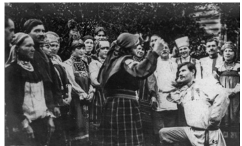
Volkstanz in der Ukraine, um 1920