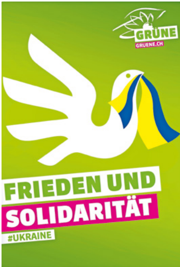
Demonstrationsbanner der Grünen Partei Schweiz, Februar 2022 (SozArch DS 3839)