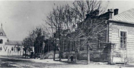
Südwestukrainische Ortschaft Schabo, die 1822 bis 1940 von Waadtländer Winzer:innen besiedelt war