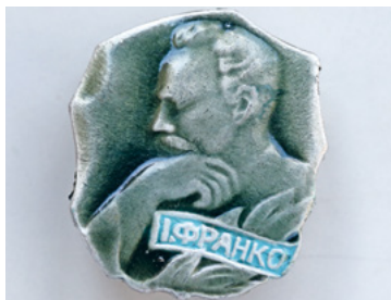
Anstecker mit dem Pionier der ukrainischen Literatur und Nationalbewegung Ivan Franko (SozArch F 5156-Ob-063)