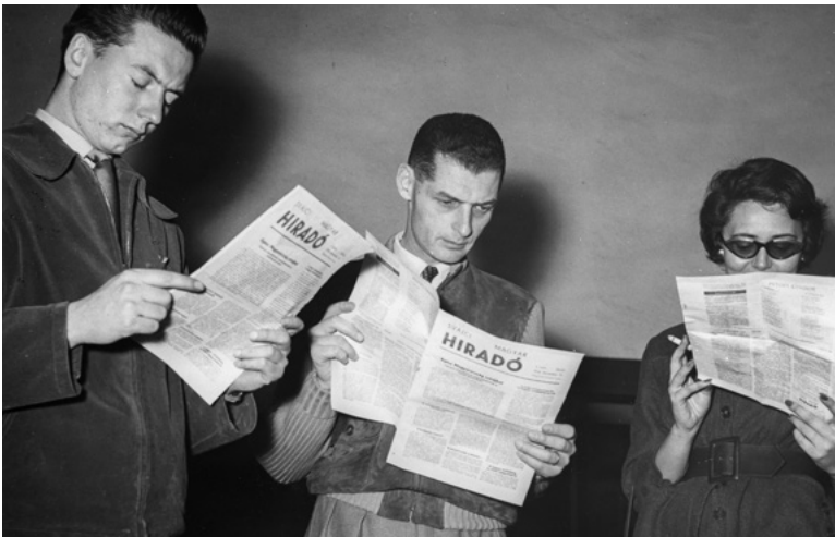
Ungarische Flüchtlinge lesen 1956 die von den Zürcher Medienhäusern produzierte Zeitung «Hiradó»