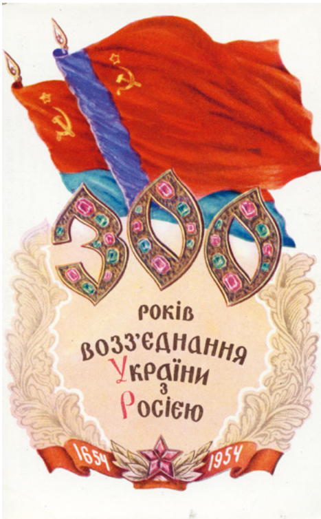
Propagandaposter von 1954: Ein von Massakern an der jüdischen und katholischen Bevölkerung begleiteter Kosakenaufstand gegen die polnische Oberherrschaft und der anschließende Vertrag mit dem Zaren von 1654 wurden in der zaristischen und sowjetischen Erinnerungskultur als «Wiedervereinigung» der Ukraine mit Russland verklärt (Urheber:in: unbekannt/ SozArch F 5008-Ka-031)