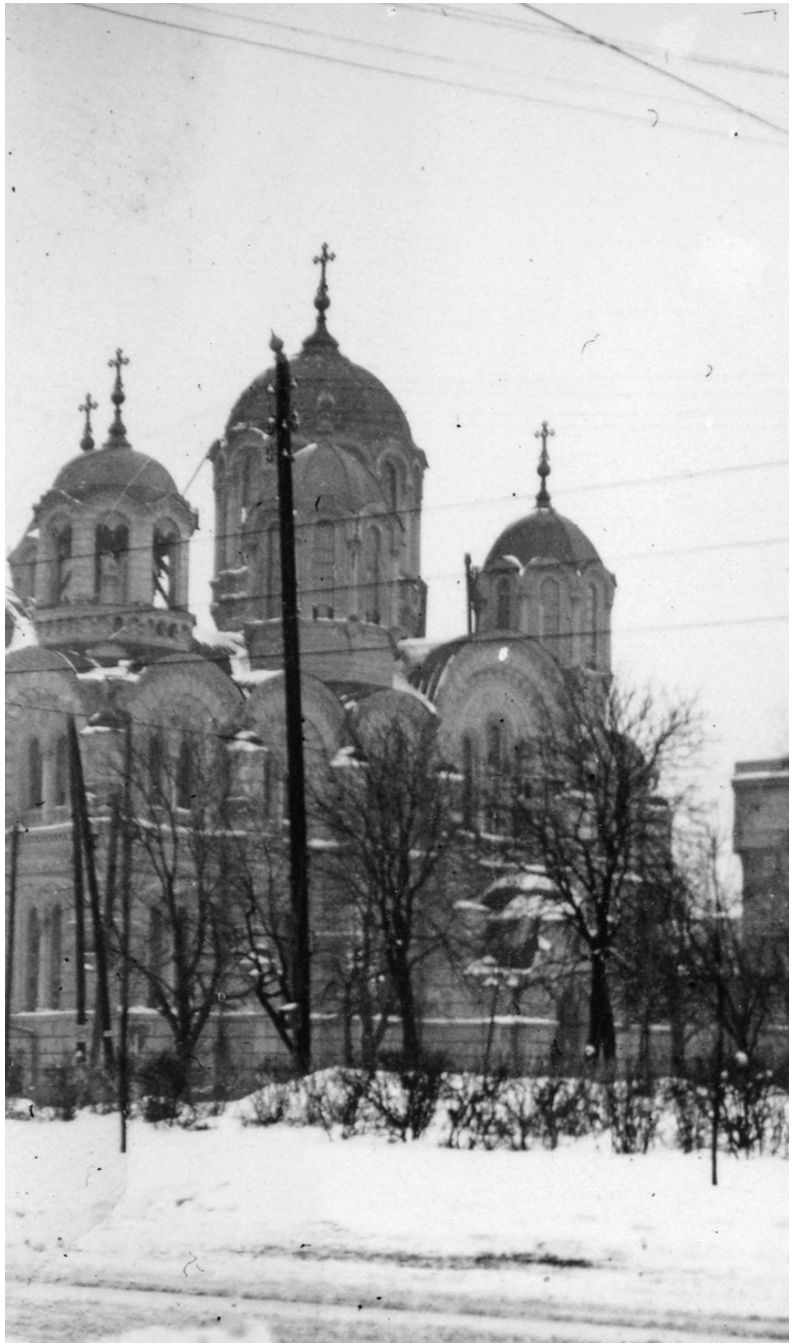
Wladimirkathedrale in Kyiv während des Zweiten Weltkriegs