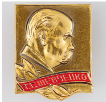
Anstecker mit dem ukrainischen Nationaldichter Taras Ševčenko (SozArch F 5156-Ob-116)