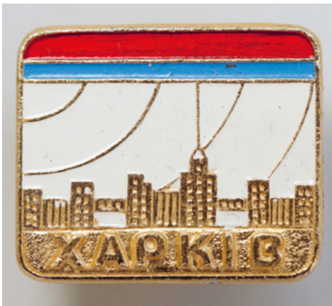
Sowjetischer Anstecker mit der ostukrainischen Stadt Charkiv (SozArch F 5156-Ob-076)