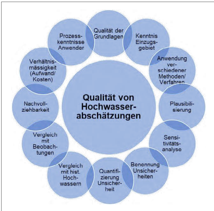
Bild 2: Wesentliche Punkte zur Verbesserung der Qualität von Hochwasserabschätzungen (Abflüsse und Volumina).