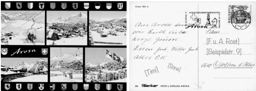
Abb. 1a und 1b: Beispiel für prototypische Themaentwicklung