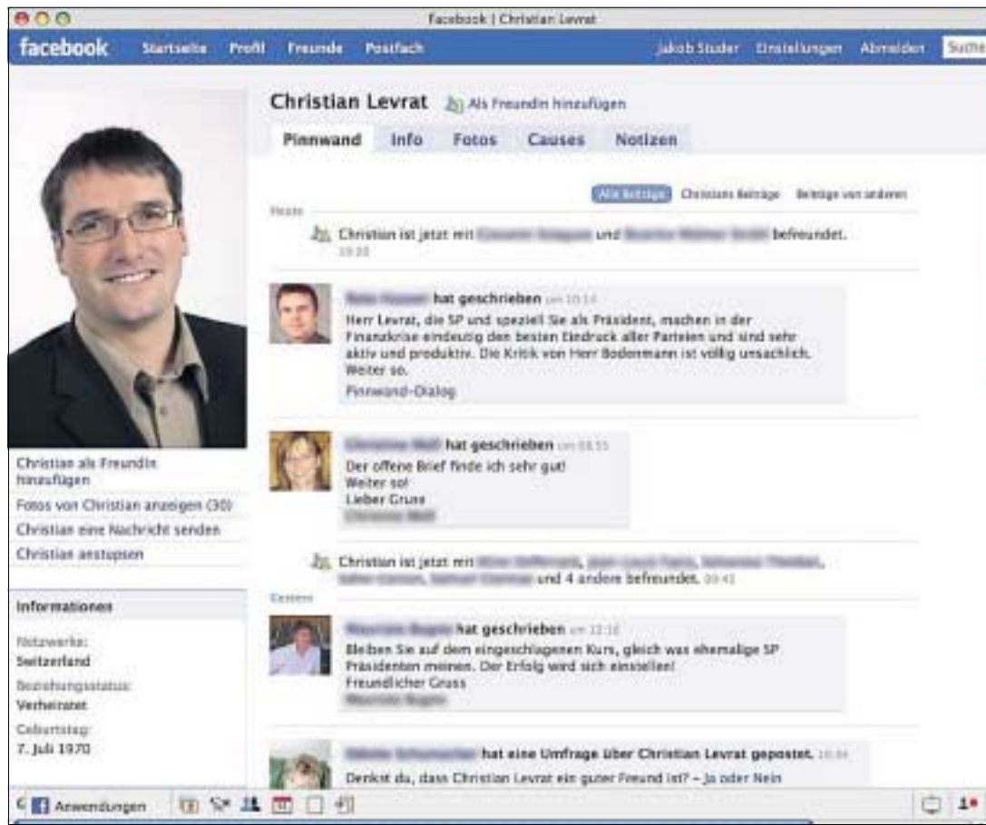
SP-Präsident Christian Levrats «Pinnwand» auf Facebook am 11. März.