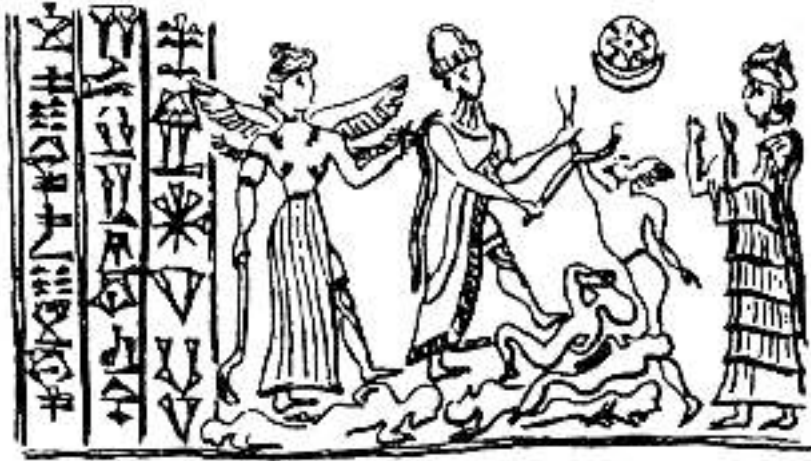
Abb. 2 Umzeichnung der Siegelabrollung des Mukannišum ( Amiet , Notes [s. Anm. 43], 230 Fig. 12).