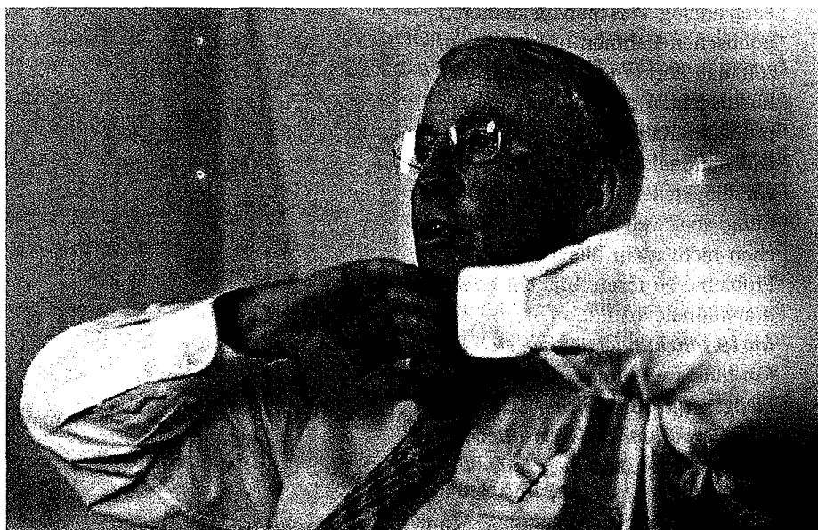
«Ich wehre mich mit Händen und Füssen dagegen, dass wir die Demokratie und die Besonderheiten der Schweiz aufgeben»: Christoph Blocher, 69, ursprünglich Landwirt, Doktor der Rechtswissenschaften, Oberst der Luftschutztruppen, Industrieller, 1979–2003 Nationalrat, 2003–2007 Bundesrat, seit 2008 Vizepräsident der Schweizerischen Volkspartei.

Blocher: Im Gegenteil. Es gab noch nie so viele neue Nationalstaaten wie in den letzten zwanzig Jahren. Das hängt natürlich in erster Linie mit dem Zerfall des Sowjetblocks zusammen. Die EU wollte die Nationalstaatlichkeit zwar überwinden, aber das hat sie nicht geschafft. Das merkt