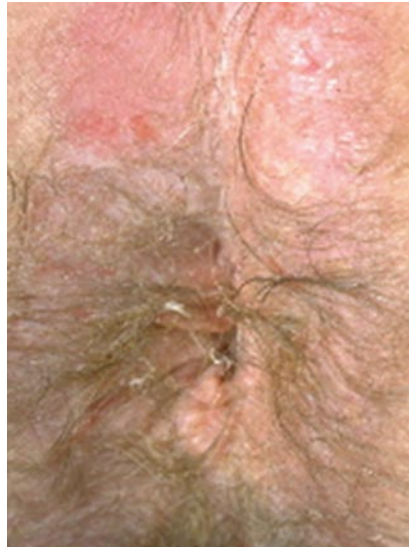
Abb. 6 ▲ Oxyuriasis