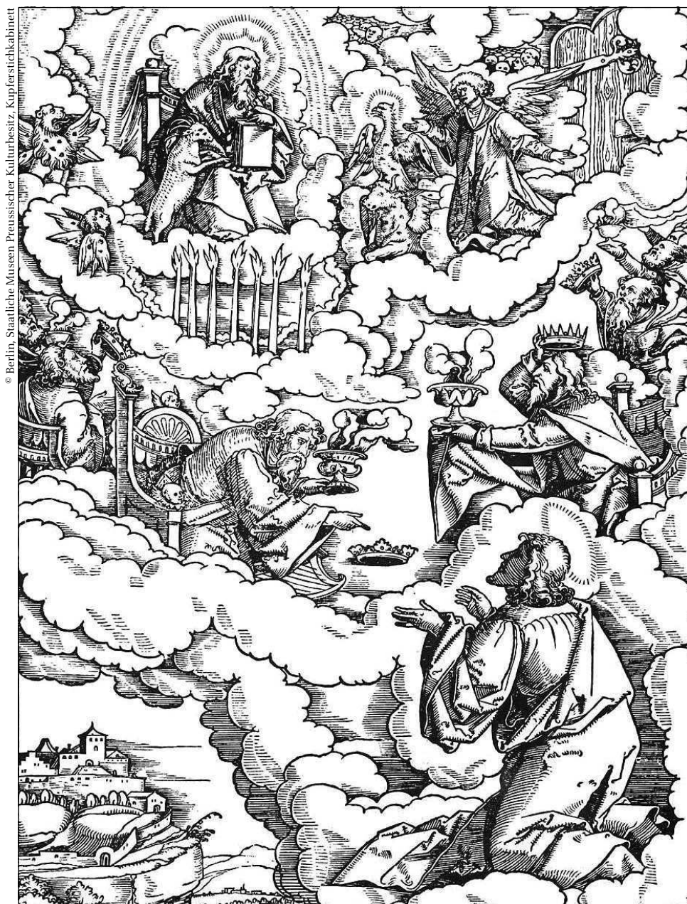
Der Seher Johannes empfängt die Offenbarung (Kupferstich aus dem 16. Jahrhundert von Matthias Gerung). Die Johannesoffenbarung hat wie kein anderes Buch der Weltliteratur auf die bildende Kunst eingewirkt.

In den Bibelwissenschaften hat sich in den letzten Jahrzehnten ein bemerkenswerter Umbruch vollzogen, dem man durchaus das Etikett eines Paradigmenwechsels zuschreiben kann: Das klassische historisch-kritische Paradigma, das auf den (historischen) Autor eines Werks fokussiert war, wird erweitert durch eine Perspektive, die sich stärker an den Lesern orientiert, also an der Rezeption . Der Text erscheint in dieser Sichtweise nicht mehr so sehr als Produkt eines (historisch oft nicht mehr greifbaren) Autors, sondern als Produkt