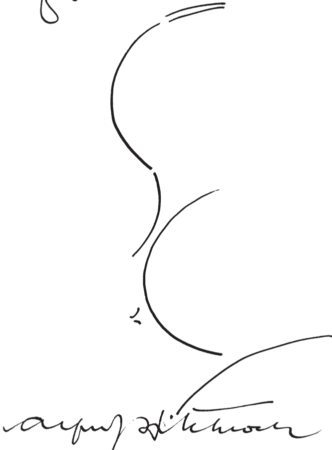
Abb. 1: Alfred Hitchcock mit Widmung und Selbstkarikatur für den Leiter des katholischen Filmbüros Charles Reinert um 1959. Charles Reinert Autogrammbuch, S. 135.