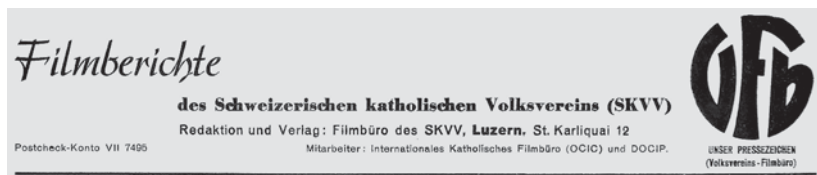
Abb. 5: Kopfleiste der Filmberichte des SKVV (1939, Nr. 1).

Im Gegensatz zu den USA blieben diese weitreichenden Ambitionen von Schweizer Katholiken vor allem Programm. Aus heutiger Sicht kann die Bedeutung solcher Forderungen jedoch darin gesehen werden, die Akzeptanz des Films unter der Bevölkerung vergrössert zu haben. In dieser Hinsicht war auch eine weitere Veröffentlichung des Filmbüros wichtig: Die ab September 1938 vierzehntäglich erscheinenden Filmberichte des Schweizerischen katholischen Volksvereins (Abb. 5). Diese beinhalteten keine Filmbesprechungen, sondern allerlei Nachrichten aus der Welt des Films: Ankündigungen von bald erscheinenden Filmen, Berichte von Filmwettbewerben, geschichtliche Hintergründe zu Produktionsländern, Informationen über neue Gesetze, die Filme betreffen, und Neuigkeiten über das katholische Filmschaffen im In- und Ausland. Die Filmberichte richteten sich nicht an die Betreiber von Vereinskinos, sondern an die Redaktoren von katholischen Zeitungen und Zeitschriften. Diese konnten den Berichten nach Belieben einzelne Artikel entnehmen und sie in ihrer eigenen Publikation nachdrucken. Die Filmberichte wurden in Zusammenarbeit mit der