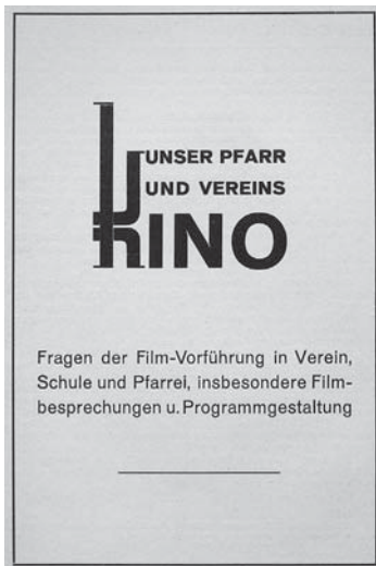
Abb. 4: Titelseite der Zeitschrift Unser Pfarr- und Vereinskino (erste Ausgabe vom Christkönigsfest (damals im Oktober) 1938).

Um der Forderung des Papstes nach einer katholischen Filmpressearbeit nachzukommen, wurde in Unser Pfarr- und Vereinskino auch damit begonnen, sogenannte «Zensurnoten» und Besprechungen aktueller Kinofilme zu publizieren. Diese reichten von «einwandfreie Filme» (Zensurnoten 1 bis 3b) über «schädliche Filme» (4 bis 4b) zu «schlechte Filme» (5 bis 6). 81 Besprechungen