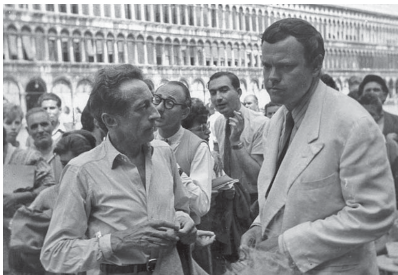
Abb. 2: Orson Welles ( CITIZEN KANE , USA 1941; rechts) am Filmfestival von Venedig 1948 mit Selbstkarikatur und Widmung. Sie lautet: «After too many films – all good wishes, Orson Welles». Charles Reinert Autogrammbuch, S. 52–53.