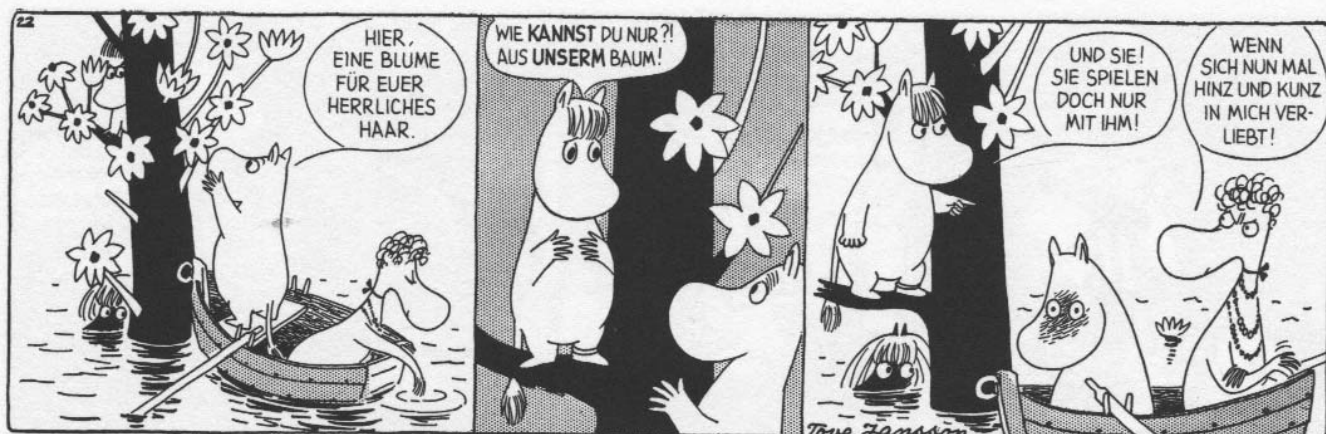
Gefühlschaos im Mumintal: In den Comics erzählt Tove Jansson Mumingeschichten für ein erwachsenes Publikum.

COMIC: TOVE JANSSON AUS: DIE MUMINS, BD. 3. - REPRODUKT 2010.