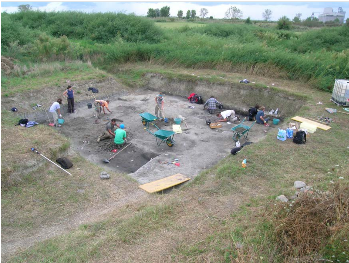
Abb. 2: Übersicht über den Grabungsschnitt in Spina (Kampagne 2010), Foto: Chr. Reusser.

2007 begann unter der Leitung der zuständigen Soprintendenza per i Beni Archeologici in Bologna eine neue Phase der Grabungen im Stadtgebiet. Das Zürcher Forschungsprojekt wird in Kooperation mit der Soprintendenza in Bologna und dank der finanziellen Unterstützung der Fritz Thyssen Stiftung in Köln sowie der Universität Zürich durchgeführt und hat zum Ziel, den Mangel an gesicherten Fakten zur antiken Stadt zu beheben und Fragen der Urbanistik, des Wohnbaus sowie der Chronologie zu klären.